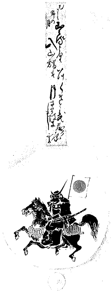
図3 狩野探幽筆「伊達政宗像」 仙台市博物館