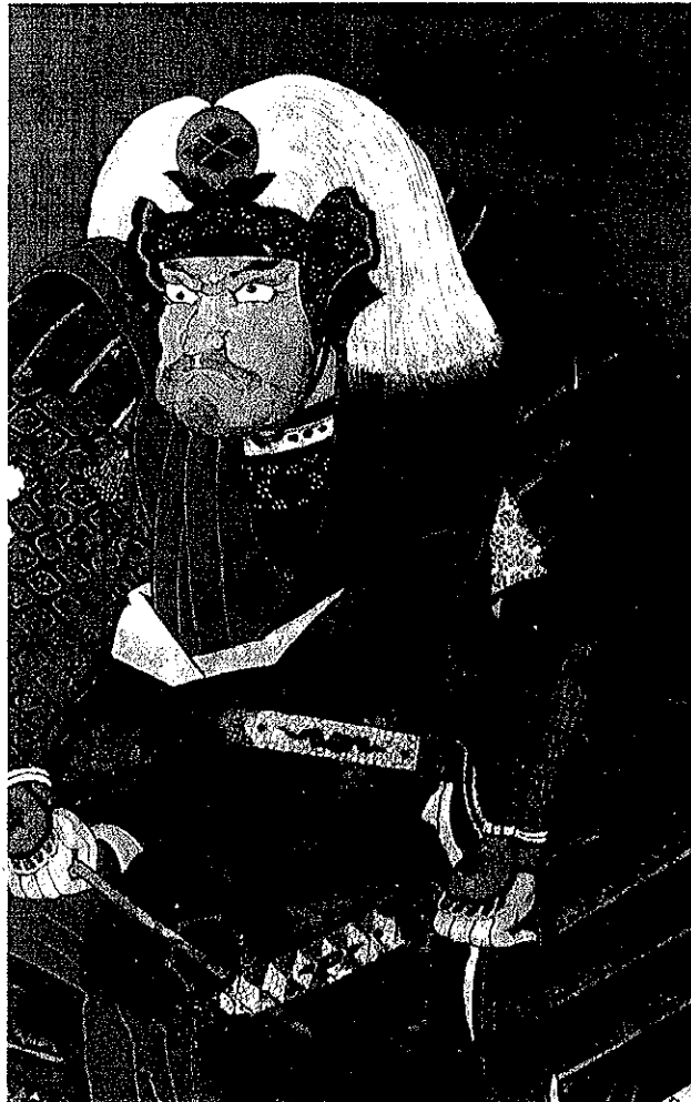
図1 白頭の兜(狩野常信筆「武田信玄像」) 長野 典厩寺