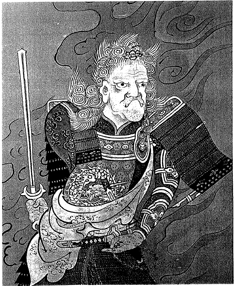
图 2-1 鎧不動尊画像 山梨 恵林寺