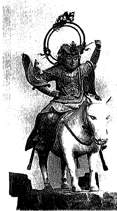
図5 康清刻「勝軍地藏像」 山梨 清水寺