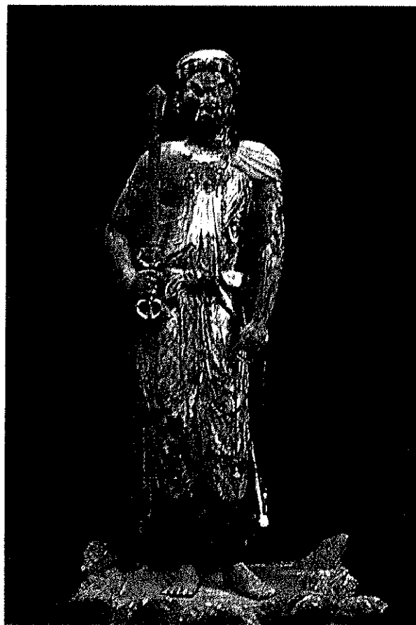
図2 「不動明王立像」 山梨 放光寺