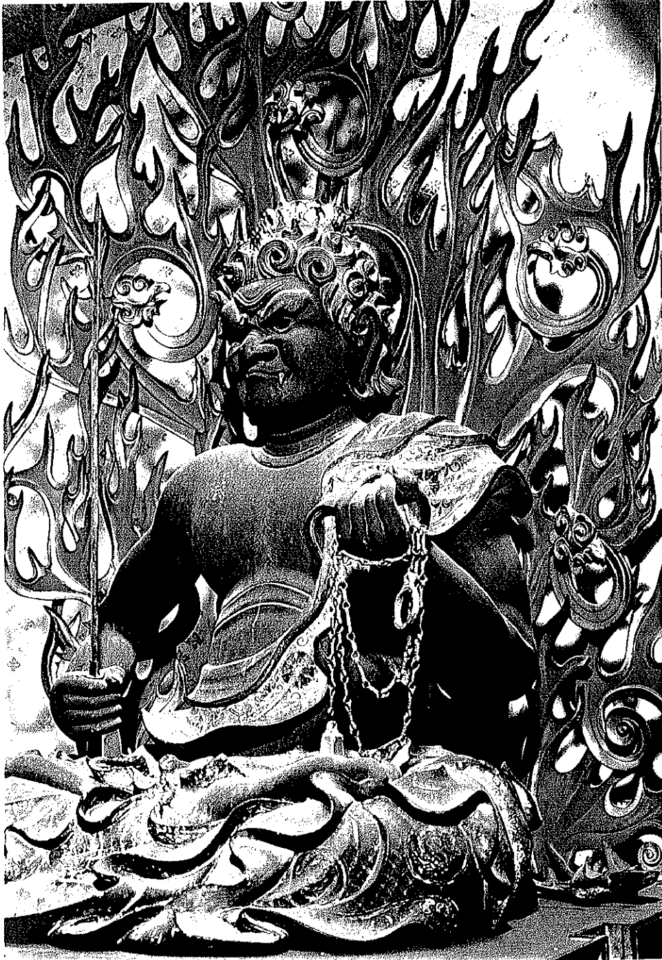
图 4 康清刻「武田不動尊彫像」 山梨 恵林寺