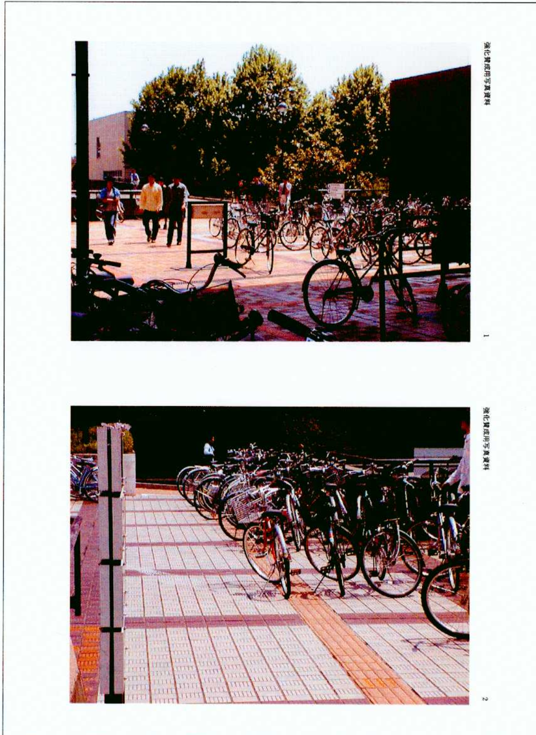
図 A.3: 写真資料 (賛成側)