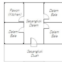
図6. バレタニ、バレボンタール平面図(Dini Aiko Subiyantoro)