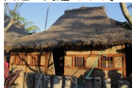
BALE TANI (ORIGINAL) Approx. 35m 2