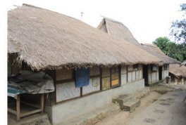
BALE BONTAR (MODIFIED) Approx. 45m 2