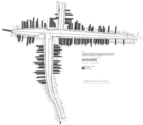
図 2. パウォマタルオ村集落平面図