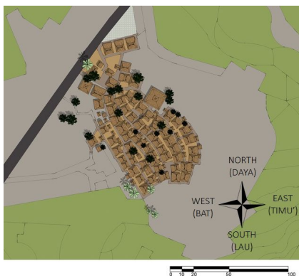
図5 サデ村平面図(Dini Aiko Subiyantoro)

サデ村の事例は慣習生活を支えてきたバレタニの生活における役割について、居住者たちの文化的意味への認識が希薄なことにある。出産はバレボンタールからバレタニに移って行われることを考えれば、ササク族の継承のためにバレタニが重要な意味を持っているわけであり、このような歴史的価値について確認することが必要と思われる。また屋根葺材のチガヤももともと共同体で管理が行われていたが、現在は共同でチガヤを育てることがなくなり、業者から購入するという。観光化に伴い、もともと共同体として機能していた農業が衰退するとともに伝統家屋に必要なチガヤのような材料の入手が難しくなっている。このような観光化による生活様式の変化に伴って周辺の自然環境との関わりが希薄となり、材料の入手が困難になることはインドネシアのあらゆる場所で見られる共通の問題である。