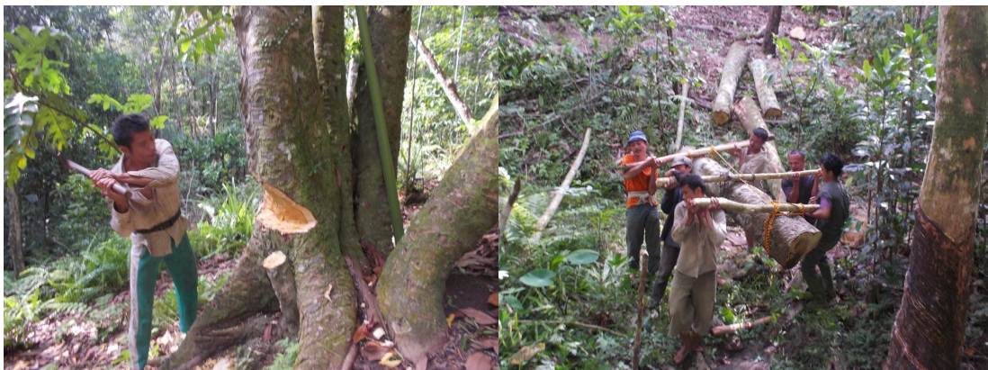
図 4 パウォマタルオ木材切出し

修理費を払えない所有者のために公的資金による文化遺産保存事業は、伝統的集落や伝統建築を保存していくために有効な手段である。今回の県政府による保存修理事業では、次の点が問題点として把握された。1 つ目は、入札による材料仕入れにより市場からの調達が行われ、所有者が森から切出してきた材料を使うことができなかった。2 つ目に、予算不足のために本来と異なる樹種の材料が使われた。3 つ目に、県の担当部局直轄のため、大工による判断が優先されず生乾きの材料の使用などが見られた。