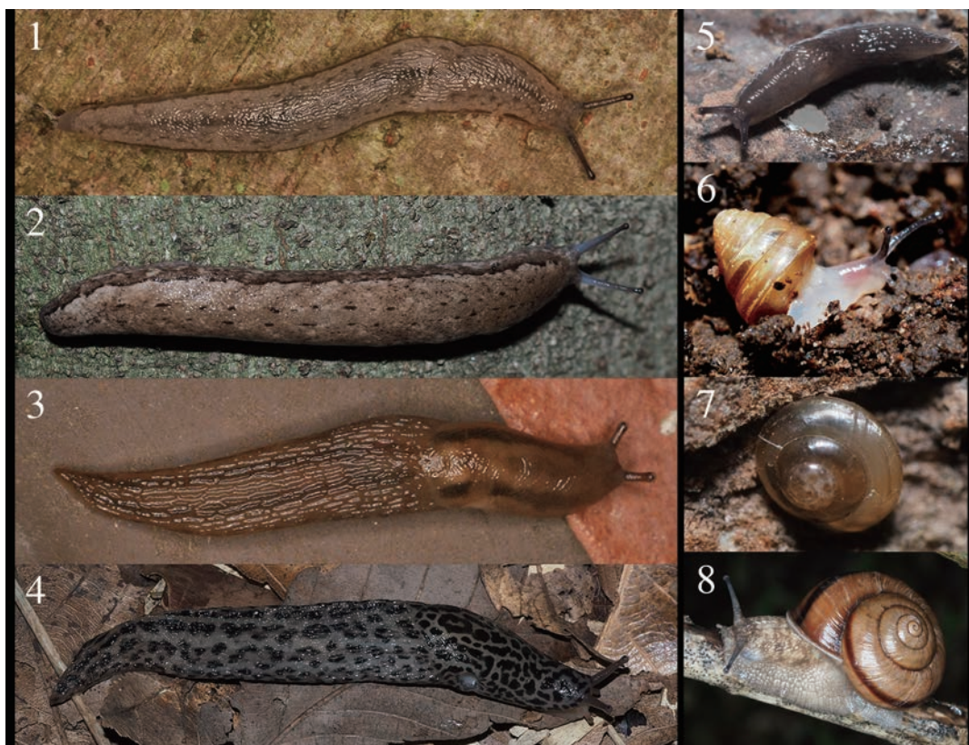
図2. 筑波大学筑波キャンパスから発見された陸産貝類 (2). 1. ナメクジ. 2. ヤマナメクジ. 3. チャコウラナメクジ. 4. マダラコウラナメクジ. 5. ノコウラナメクジ属の一種. 6. カサキビ. 7. マルシタラ (幼貝). 8. ヒダリマキマイマイ.