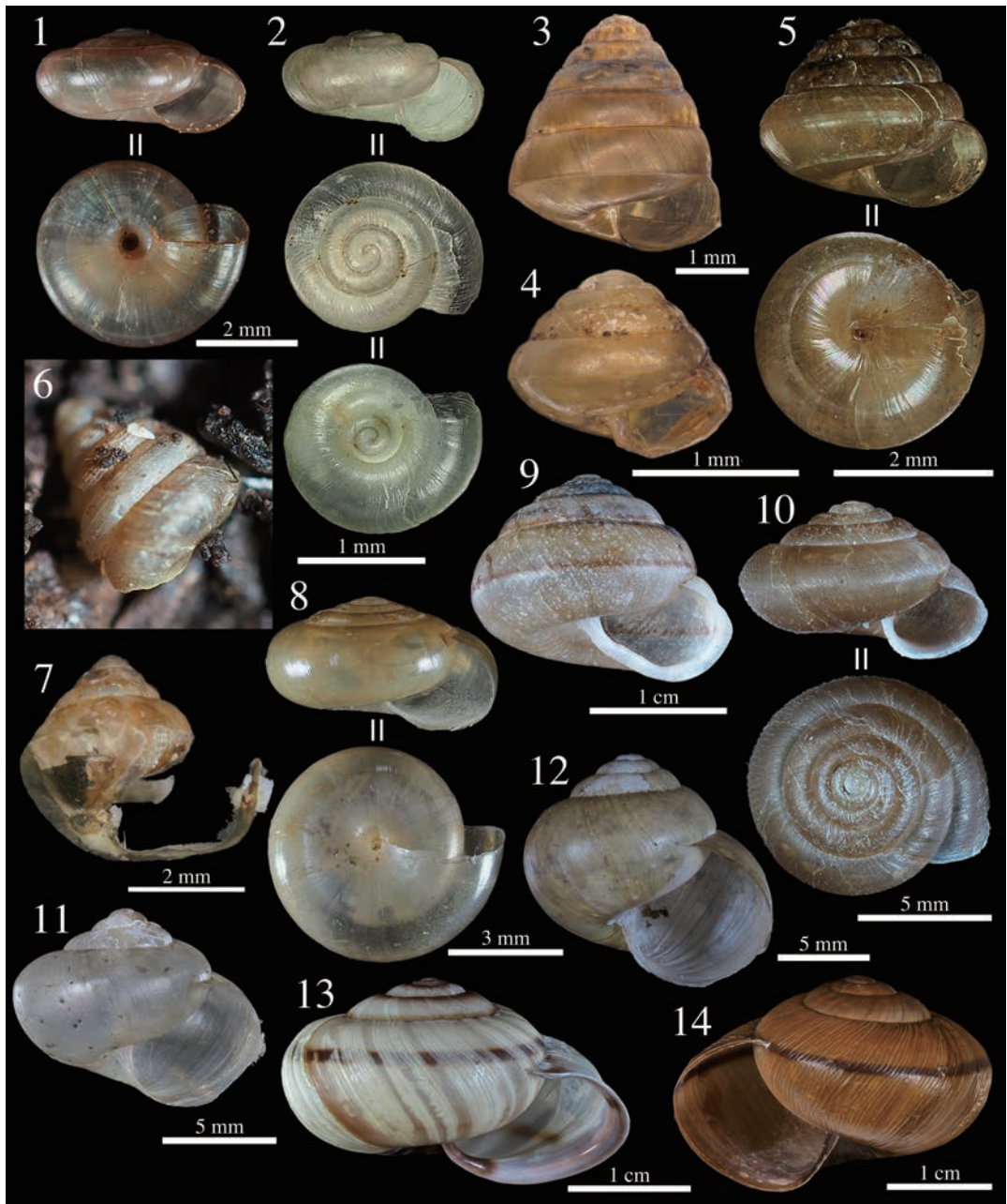
図3. 筑波大学筑波キャンパスから採集・発見された陸産貝類 (3). 1. コハクガイ, 2. ヒメコハクガイ, 3. カサキビ, 4. オオウエキビ, 5. ハリマキビ, 6. コシタカシタラ, 7. マルシタラ, 8. ウラジロベッコウ, 9. ニッポンマイマイ, 10. トウキョウコオオベソマイマイ, 11. コハクオナジマイマイ, 12. ウスカワマイマイ, 13. ヒタチマイマイ, 14. ヒダリマキマイマイ.