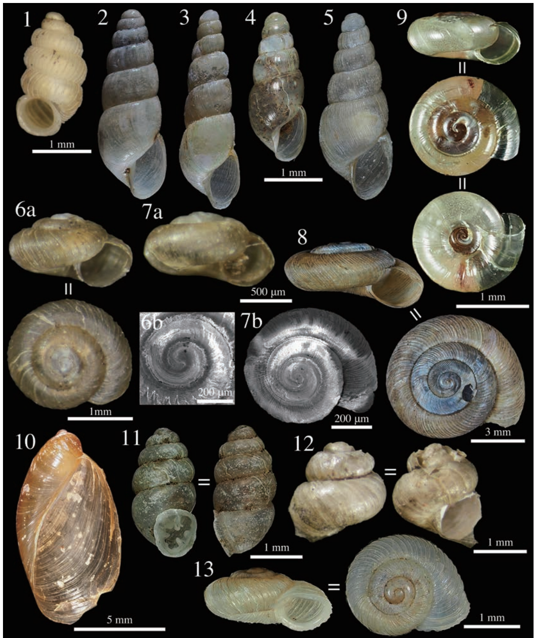
図1. 筑波大学筑波キャンパスから採集された陸産貝類 (1). 1. ヒダリマキゴマガイ, 2. オカチョウジガイ, 3. ホソオカチョウジガイ, 4. サツマオカチョウジガイ, 5. トクサオカチョウジガイ, 6. ナタネガイ, 7. ミジンナタネガイ, 8. パツラマイマイ, 9. ノハラノイシノシタ, 10. ナガオカモノアラガイ, 11. スナガイ, 12. ヒラドマルナタネガイ, 13. ミジンマイマイ.