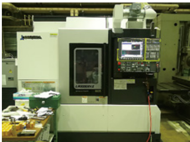
図1. LB3000EX II_外観