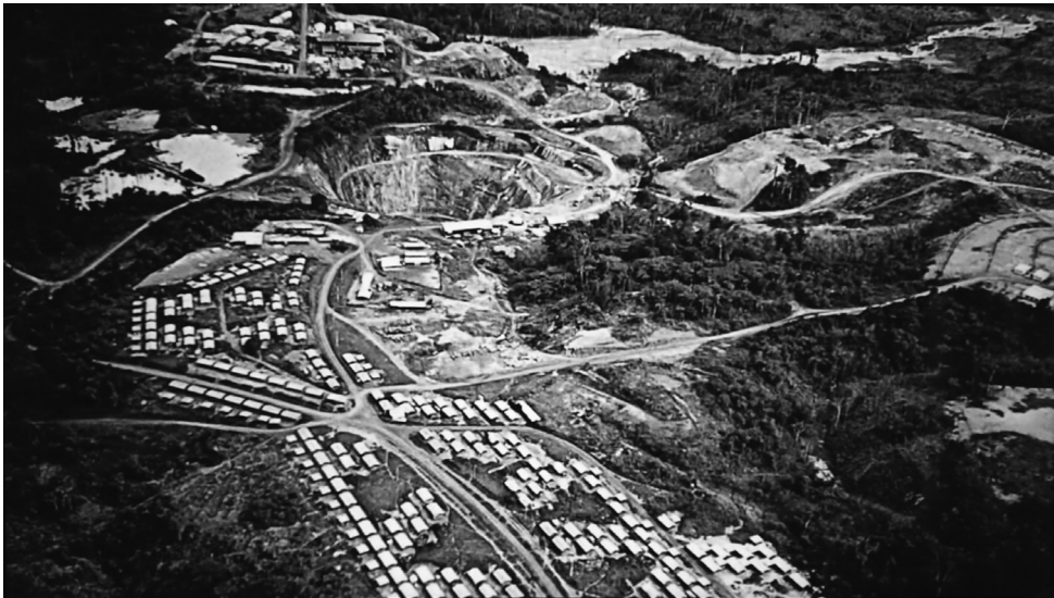
写真 2. ムナナのウラン鉱山の露天掘り(撮影年不明)

次の写真は、エリク・ミシエルのドキュメンタリー映画「ムナナ、見えない傷」(Michel 2017) に挿入されている西側から接近する航空機から撮影されたすり鉢状の露天掘り鉱山だ。手前にはウラン鉱山で働く一番下の階層の鉱山労働者たちの近代的な住宅が並ぶ「刷新の町」が見える。これらの住宅は、ウラン鉱石から選鉱を取った後に残った尾鉱を建材として建設されたから、住んでいるだけで被曝する家が少なくとも 120 軒あったことが 2007 年に行われたフランスの NGO シェルパの調査の後に明らかになっている。露天掘りの鉱山のすぐ西側(写真ではすり鉢状のウラン鉱山の下の木がない土地)にはムナナ FC のサッカー場が造られた。どこかで見た風景だ。CEA が創設してコジェマが運営したウラン精錬・濃縮工場があったグーニョンだ。そこでは核廃棄物を地下に埋めた上にサッカースタジアムの駐車場が造られたのだった。ここでも同じ組織が同様のトリックを使って再建という名の埋め立てを行なった。だが両者の間には重要な違いがある。