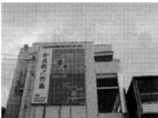
写真1 隠岐西郷港に掲げられた看板

2008年7月、今回改定された中学校学習指導要領の社会科解説書をめぐって、竹島の存在が俄かに注目されることとなった。とはいえ、東京などで生活する者にとっては、やはり観念上の問題という性格が強く、どこか遠い世界のことのように感じられているのが現状だろう。しかし、これが竹島に最も近いというよりは、行政区画の上では竹島を管轄する隠岐に行くといささかその様相は違ってくる。まず、鳥取県の境港や島根県の七類港とを結ぶフェリーが発着する島後の西郷港の建物には「かえれ！竹島」と書かれた看板が掲げられ、建物の外に出ると「竹島！かえれ島と海」という立て看板もある（写真1・2）。