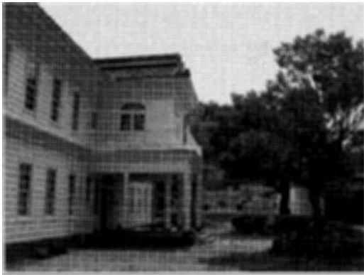
写真4 隠岐郷土館の建物

などで使われた道具類、あるいは島の生活で用いられた日常用具を展示することを基本的な目的にしている。しかし、この郷土館が他ではまねのできない独自性を持つのは、決して大きなスペースをとっているわけではないにしろ、ここに「竹島関係展示コーナー」というものが存在していることである。この島後の北部に位置している久見の港は、かつて竹島での漁に出かけてゆく出発地もあった。したがって、ここには竹島で実際に漁をした経験を持つ者も住んでいる。竹島に関連したいろいろなものが残っているのもこの地域である。そして、この郷土館では、隠岐の生活のそういった歴史に思いを致すために、かつて竹島で行っていた漁業の様子を撮影した写真や実際に使っていた漁具、さらには竹島から運んできた石