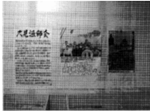
写真6 竹島での漁業の様子と地元の声

真6)したり、島根県で作成した解説ビデオテープなども流している。こうした展示や解説を見ると、隠岐という土地には、本土とは違った「もう一つの日本」があるという思いにさせられるのである。