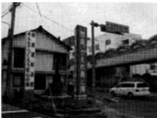
写真2 西郷港前の道路に立つ看板

隠岐は離島とはいえ古代より四つの郡からなる律令制度下の一国であり、国造も存在している一つの文化的なまとまりを持った地域であった。その中の最大の島である島後は5～600m級の山々を境にして周吉郡と隠地郡とに分かれており、竹島の行政上の地区名はこの隠地郡五箇村竹島というものである。現在は町村合併などにより島根県隠岐郡隠岐の島町となったが、その所管はそのまま引き継がれている。