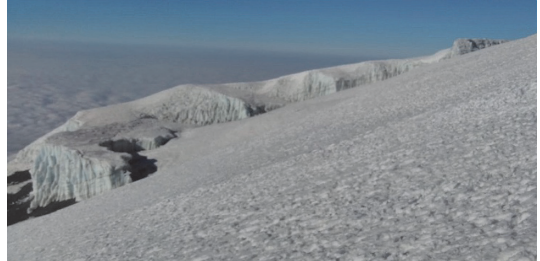
写真 2 Uhuru-Peak 手前から見下ろす南稜のレブマン氷河.