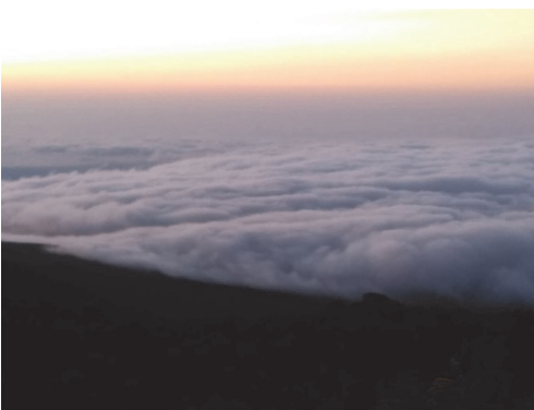
写真 5 標高 3000 m 以下に広がる雲海.