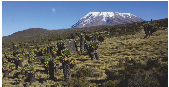
写真 4 標高 3800 m 付近のジャイアント・セネシオの群落とキリマンジャロ・キボ峰.