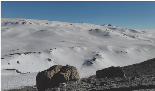
写真 3 クレータ周辺に広がる雪原，遠方に北東稜の氷河が見える.