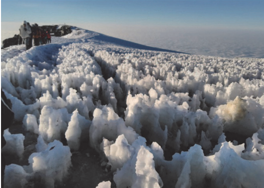
写真 1 Uhuru-Peak 周辺に発達するペニテント，高さは 30-50 cm.