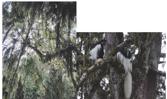
写真 6 雲霧林 (2500 m 付近) とその中に生息するクロシロ・コロンプス.