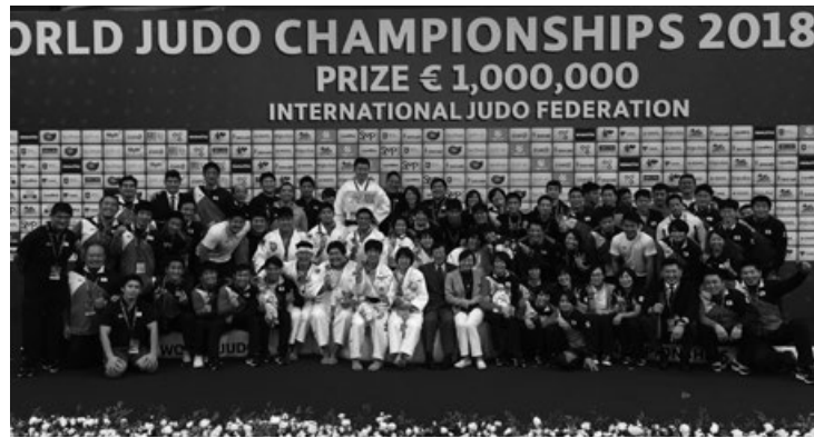
写真 6 世界選手権全日本チーム集合写真

行為や選手の言葉を全く異なる表現として伝える行為など年々エスカレートしているように感じる。選手達がメディアから取材を受ける際、過度なプレッシャーを感じないよう、専門家を招聘しメディア目線での言動などを知ることも重要である。