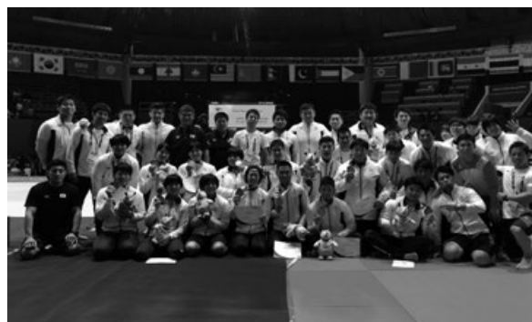
写真4 アジア大会集合写真