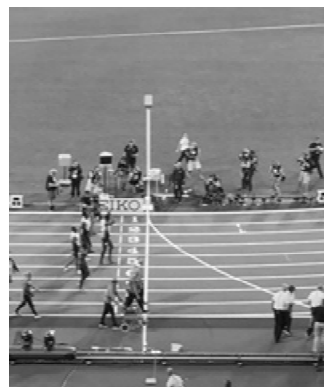
写真6 怪我をしたボルトの競技最後のフィニッシュ