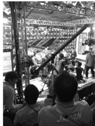
写真5 メダル獲得をしたメンバーのTBS番組

このように、東京2020に向けて若くて層の厚い短距離チームが出来上がっている。しかしこのチーム、リレーのメダルの背景には、2000年以降のオリンピック、世界選手権では14回のうち12回の決勝進出を果たし、3回のメダルを獲得しているということが考えられる。これまで個人種目での決勝進出が難しく、バトンでのスピードロスの抑制を目指し合宿を重ね、現地にも科学委員を帯同させて、よりバトンの精度を高めてきた背景がある。今回も予選のデータを分析して、アンカーを交代してデータをもとにチーム全体として、どうやったら日本がメダルを取れるかを考え、メンバーを交代したことが結果につながったと選手・コーチとも語っている。個人での100m決勝進出は果たせなかったが、数人がファイナリストに近づいており、東京2020では個人種目の決勝進出とリレーでのより色の良いメダルの獲得がおおいに期待されてきている。