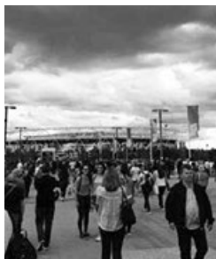
写真1 会場外の様子

通称、ロンドン世界陸上、国際陸連（以下、IAAF）World Championship London 2017 は、2017年8月4日から8月13日までの10日間、イギリスロンドンにて開催された。世界陸上は、オリンピック、サッカーW杯と並ぶ世界の三大スポーツイベントと言われおり、1983年に150以上の国と地域が参加し第一回大会が開催された。今回は、200の国と地域から約2000人の選手が参加した。はじめは4年に一度だった世界一を決める大会開催は、オリンピックの中間年に開催されていたが、1991年の東京世界陸上以降、2年に一度に変更され、オリンピックの前年と翌年におこなわれるようになった。今回は、近代陸上競技の発祥の地であるイギリスということもあり、競技場さらには街とメディアの想像以上の盛り上がりは、過去数回の世界陸上とは比較にならないものであった。男子100m決勝のチケットの売り切れだけでなく、連日1万円以上する席、8千円ほどの中間の値段の席にも多くの観客が午前・午後ともに数万人以上が押し寄せていた。