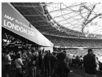
写真2 会場内の様子

地元選手の応援もさることながら、トラック種目・フィールド種目に関わらず、観客の殆どが注目の選手を知っていたようだ。トラックだけでなく