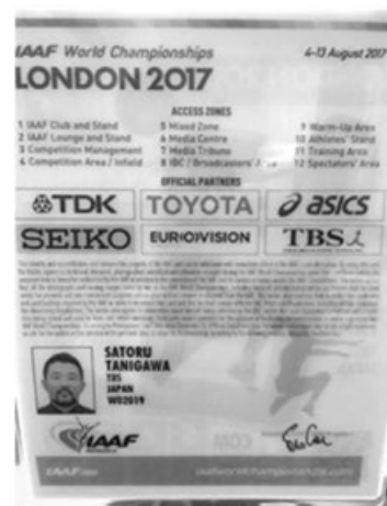
写真7 オフィシャルスポンサー

ここ数回の世界陸上の人気はボルト頼みところがあり、試合日程までボルトの出場種目に合わせて変更してきた。しかし、IAAF、日本の代理店を通じて放映権料は年々高騰し、現在数百億になっており、オフィシャルスポンサーの6社中5社が日本企業で、その半分以上を日本のテレビ会社が払っている状況であろう。しかし、スター選手の不在、日本との時差によって視聴者が少なくなること、さらにインターネット放送やツイッターでの映像など様々な映像媒体によって試合映像が配信されていく傾向を考えると、テレビ広告料を主とした現状のテレビ局による大きな投資は長く続かないことが考えられる。したがって、試合のメディア価値を上げることが、競技を放送する側だけでなく、IAAFなどの運営側、さらに競技をおこなう選手側からも行っていく必要があると考えられる。バスケットボール男子の新リーグ「Bリーグ」がネット放映権込みのスポンサー契約を推定で4年総額120億円おこなった。Bリーグ1部の全試合もスポンサライブで生中継される。放映権料が問題になりオリンピックもパリとロサンゼルスが同時に開催都市に決定している。今後、ネット放送の普及、放映権料のコントロールは今後世界陸上を継続していく上で大きな課題になりそうである。