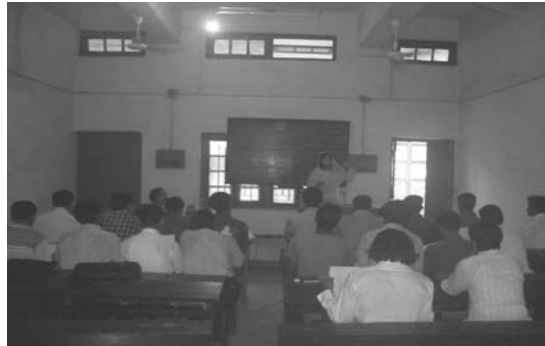
(Picture 1: Briefing the Surveyors about the survey and forming groups on 7 th September, 2006)

11. Survey begins, constant contact with the surveyors: The survey began on 9 th September. The surveyors at first went to the Sub-district office, collected the local map of the each area and met the government officials in charge of the social welfare and cooperatives and updated the sample list they were provided and gathered more information about the location of the organizations. Then they began their survey. In total 504 Questionnaires were filled in from 9 sub-district and Rajshahi city. The surveyors were to go to the field every day unless they had class/exam or urgent engagements. In every two days, they in person came to meet me and submitted the filled in questionnaires and I checked those in front of them, so that they don't do the same mistake again. Then they were given enough fresh questionnaires for the next two days. The number of filled in questionnaire submitted and the number of fresh questionnaire distributed for each day and the number of working days for each surveyor were, recorded down. Everyday, from time to time, I kept contact with them over phone. Whenever necessary they also rang me.