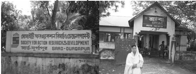
( picture 2&3: Pictures taken during field trips- Durgapur, Mohonpur Subdistricts)

10 th Sep. went to Poba Sub-district, 12 th Sep. to Mohonpur Sub-district, 15 th to Durgapur Sub-district, 17 th Sep to Bagmara Sub-district, 19 th to Charghat Sub-district, 21 th Sep. visited within Rajshahi city, 27 th to Puthia Sub-district and city.