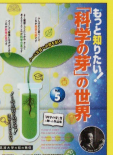
第9回、第10回の「科学の芽」賞 受賞作品集