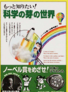
第3回、第4回の「科学の芽」賞 受賞作品集