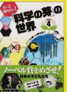
第7回、第8回の「科学の芽」賞 受賞作品集