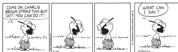
図 1 ストーリーを英語で説明する

（例 2）Write within 100 words in English in answer to the following question: