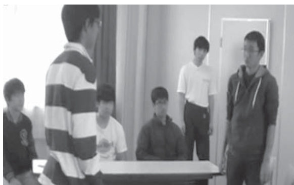
映画のシーンを演じる

3 学期は授業数が少ないが、もう一度「会話」という点に戻り、同意や反論、提案などの表現を扱う。