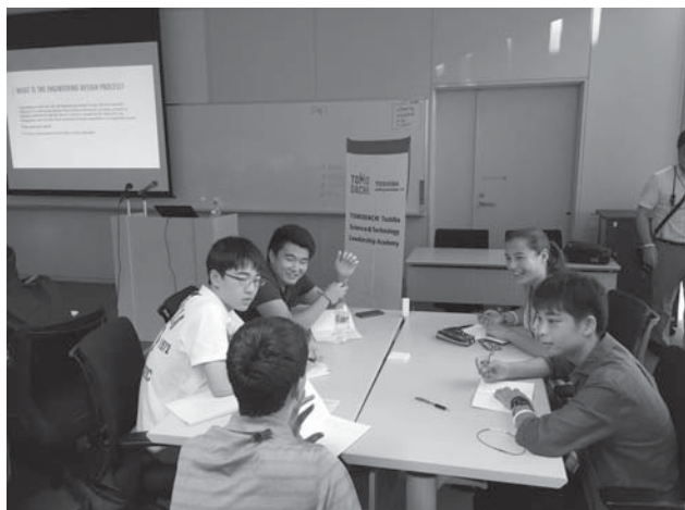
チーム内で議論する