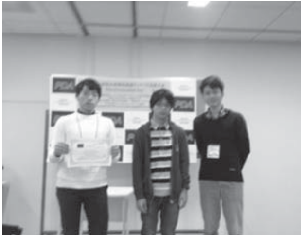
即興型英語ディベート全国大会 表彰式