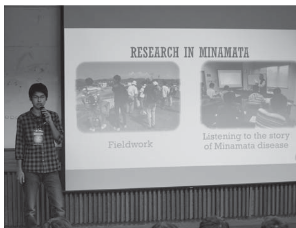
水俣病に関する発表

ただ、台中一中の発表では原稿を見ながら行った生徒は皆無だったが、本校の場合はまだ原稿に頼っていたグループもあった。その点ではまだまだ課題があり、今後の彼らの切磋琢磨と成長がいつそう楽しみである。