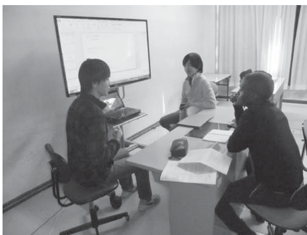
イングリッシュ・ルーム講師に助言をもらう

Vierheller 夫妻とイングリッシュ・ルーム講師との間でアドバイスの内容が食い違う場合もあったが、各自が自分の事情にあわせて適宜取舍選択するように、という助言も行った。また、他人のプレゼンを聴いた後は積極的に質問をするように、ということも折に触れ指導している。