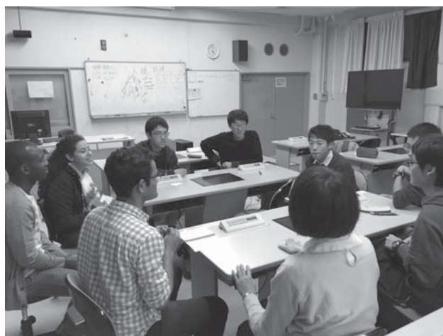
講師たちとゲームを楽しむ

放課後は、生徒たちも意外と部活動などで忙しく、また活用する生徒も限られているので、それをいかに多くの生徒に還元し、魅力的なプログラムにしていくかを考えていきたい。