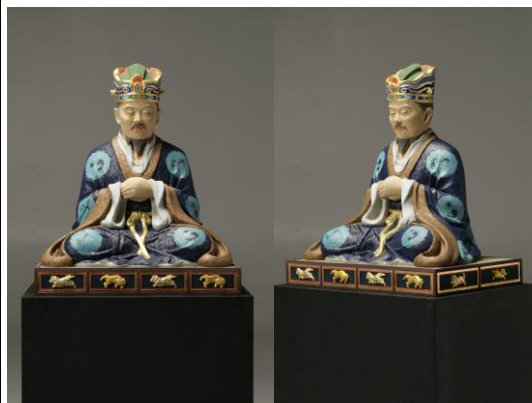
湯島聖堂本尊孔子胡坐像（彩色復元像）