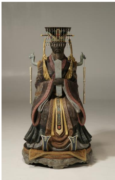
孔子袞冕倚像-江戸前期の美術資料による- 一驅 等身 乾漆・彩色（正面図）