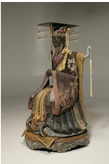
孔子袞冕倚像-江戸前期の美術資料による- 一驅 等身 乾漆・彩色（斜面図）