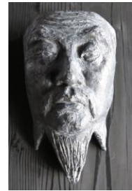
右：新海竹太郎作「大成殿孔子尊像」マスク模刻（テラコッタ）