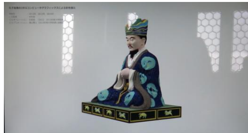
孔子坐像の3次元コンピューターグラフィックス