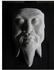
左：康音作「大成殿孔子尊像」マスク模刻（テラコッタ）