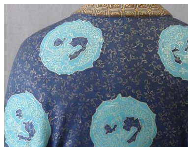
金泥による文様（部分） 丸龍文様と花唐草文様