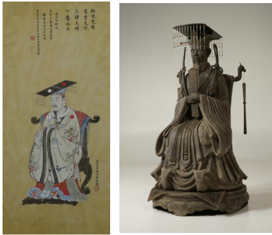
左；英一蝶《孔子画像》（斯文会蔵）の模写 右；孔子袞冕倚像（乾漆素材での完成）