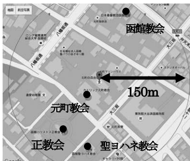
図-1 対象教会の位置関係 (Google Map に加筆)

設された。聖堂は尖頭型アーチとアーチ型天井、建物の垂直性の強調が特徴のゴシック様式となっており、司祭館、門柱および石塀と併せて伝統的建造物に指定されている。聖堂内部正面の中央祭壇、脇祭壇、およびイエスが死刑宣告を受けてから十字架にかけられ墓に葬られるまでの過程を表した聖堂両壁のレリーフ「十字架の道行」は、教会が火事に合ったことへの見舞いとして、1923 年、時のローマ教皇ベネディクト 15 世によって寄贈された。