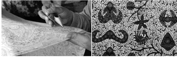
図2 チャンティンを用いたロウ置き 図3 古典文様

宮を象徴する古典文様にその特徴が見出される(図2)(図3)。また、バティックは本来、王宮内の伝統的な価値観や慣習とむすびつき、主に王侯貴族の子女によって実践されるものであった 8 。時代が下るにしたがって、王宮から王宮周辺へ、さらに一般社会へとその実践が拡大したが、その過程においても、王宮を中心とする地域はジョグジャカルタのバティックの実践・継承においてなお重要な地域であった(図4)。