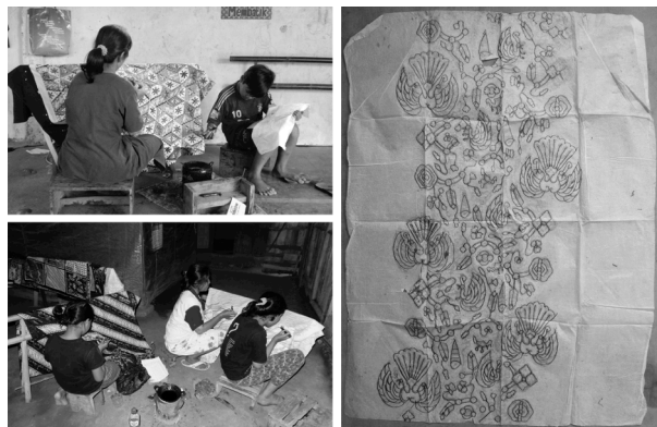
図8(左上) 図9(左下) 親子でロウ置き作業を行う様子 図10(右) 古典文様の型紙

※ウキルサリ村のバティック職人51名に対して質問①を行い、回答(1)と答えた職人38名に対して質問②を行った