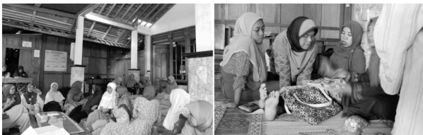
図11(左)図12(右) アリサンおよび寄合の様子

このようなアリサンやシンパン・ピンジャムの活動は、単に経済的な機能を担っているだけではなく、ゴトン・ロヨン(Gotong Royong)と呼ばれるインドネシアの伝統的な相互扶助慣行の実践の一例として、コミュニティの調和形成にも機能していることが指摘されている 15 。また、職人へのヒアリングを通して、このような互助活動に参加できることが、生産組織に所属しながらバティックの実践にたずさわる主要な動機の一つになっているということも確認された。