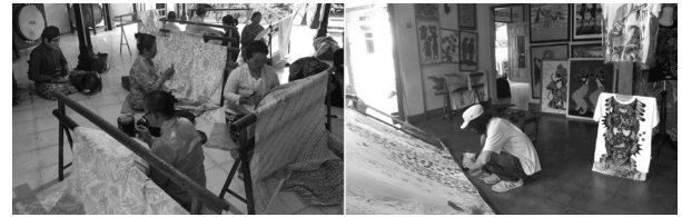
図5 王宮敷地内のバティックの様子 図6 タマンサリ集落のバティックの様子