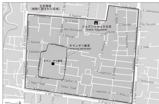
図4 ジョグジャカルタ王宮周辺図 (Google Map より作成)

さらに、ジョグジャカルタ特別州政府商工局による2015年の中小産業に関する調査から、バティック産地の分布と生産者数について整理した結果、産地は王宮所在地のジョグジャカルタ市内よりも郊外の農村部に多く分布し、生産者の数も多いことが把握された(表1)。