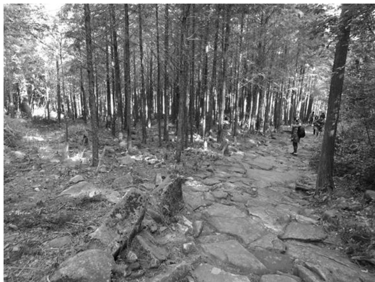
図6 守られているから利用できる（熊野参詣道）

観光は経済効果を生み出すため性急に結果を求めたくなるが、世界遺産を観光の対象とすることは地域全体を見つめ直すことであり、長期的視野にたち時間をかけて構築していくべきであろう。