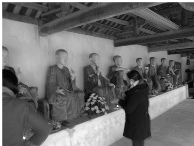
図4 祈りを捧げ価値を見出す （ベトナム・ドンラム村ミア寺）

例えば寺社仏閣は、ただ建造物を見るだけでなく祈りを捧げることで、観光客は建築物を見るだけでは見出せない価値を見出すことができよう（図4）。一方、庭園は本来、建物の使い方も含めた敷地全体の利用の中で、周辺環境も含めて施主や設計者が作り上げたはず（客間からの眺めやからの眺め、茶室と露地、借景等）だが、庭園にだけ入れるようにして、本来の価値（施主や設計者の意図）が理解できないような状況にあるものも多い。他にも、宮城県松島では、古来より内陸の展望地から多島海景観が鑑賞されてきたのだが、近代以降そうした鑑賞様式とは異なり海岸線に展望施設等を整備するようになった 14) 。現在は遊覧船で湾内を巡り、松島域内の回遊行動が低下し、湾内以外での滞在時間が低減してしまっている 15) 。