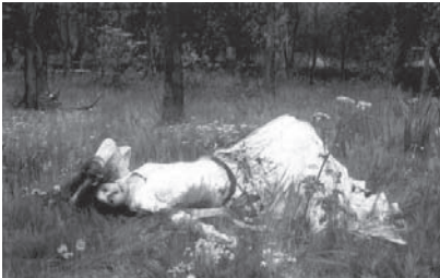
図7 ジョン・ウィリアム・ウォーターハウス 《オフィーリア》1889年 油彩・カンヴァス、98×158 cm、個人蔵