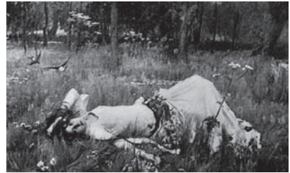
図9 ジョン・ウィリアム・ウォーターハウス 《オフィーリア》(1889年) 加筆前の写真