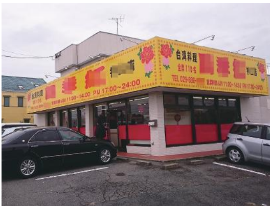
図8 中国東北地方出身者が経営する「台湾料理店」 (茨城県土浦市, 2016年10月撮影, 一部モザイク修正)

では、中国東北地方出身者が、「中国東北料理店」でなく、なぜ「台湾料理店」の看板を掲げる