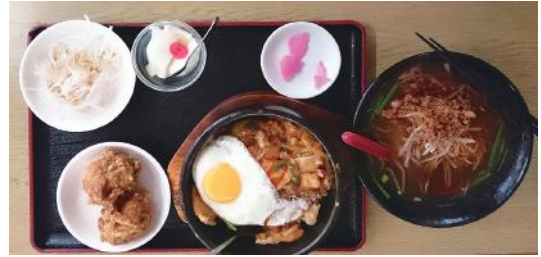
図9 「台湾料理店」(図8)の台湾風キムチ飯定食 右端が台湾ラーメン。そのほかキムチ飯、豚のから揚げ、ダイコンの千切り、杏仁豆腐、漬物。定価880円である。