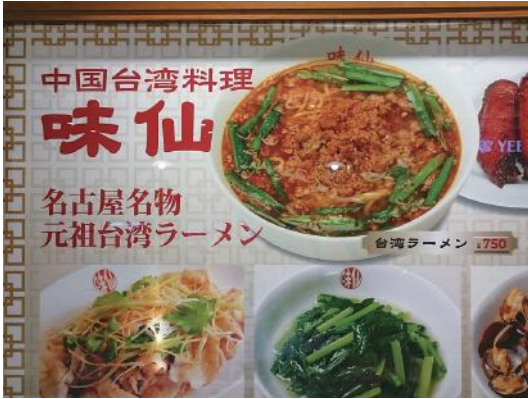
図10 名古屋の中国台湾料理店「味仙」の台湾ラーメンのメニュー