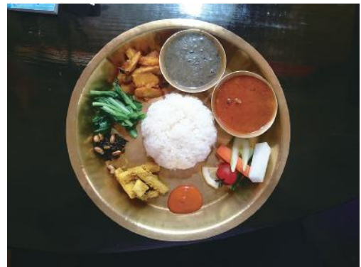
図12 ネパールの代表的な家庭料理, ダルバート・タルカリ

ネパールの代表的な家庭料理は、ダルバート・タルカリである(図12)。ダルは豆のスープ、バートは炊いたご飯で、タルカリは野菜のおかずのことである。「インド・ネパール料理店」の日本人