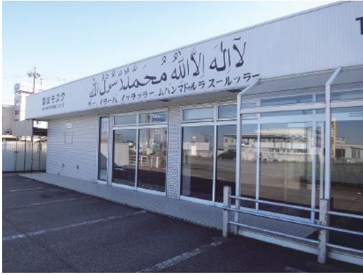
図3 富山モスク（富山県射水市） 閉業したコンビニエンスストアの敷地・建物を再利用。 （2014年9月撮影）

東南アジア、南アジア、西アジア、アフリカ、オセアニア、南アメリカなどに輸出されている（福田編，2013）。