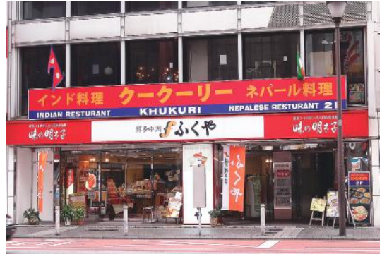
図11 インド・ネパール料理店(北九州市小倉区) 右側にインド国旗、左側にネパール国旗が掲げられている。

日本におけるネパール人の増加に伴い、「インド・ネパール料理店」を全国各地で見かけるようになってきた(図11)。「インド・ネパール料理店」という看板を掲げながら、店内で働いているのはネパール人という例が多い。日本ではネパールは馴染みが少なく、マイナーであるネパール料理では、日本人客を引き付けるのが困難であるために、日本ではよりメジャーである「インド料理店」の看板を借用した借り傘戦略が採用されたのである。