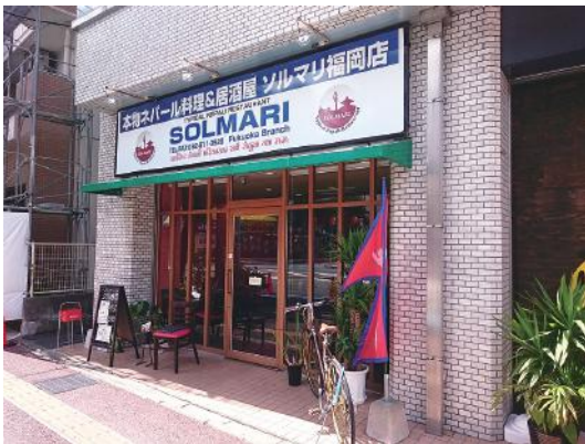
図7 福岡市南区大橋におけるネパール料理店 付近にはネパール人留学生が多い日本語学校がある。 この店は、東京都新宿区大久保にある本店の福岡支店 である。

また茨城県では、これまで同県の農業で重要な役割を果たしてきた技能実習生の供給元であった中国に代わる国として、ベトナムに期待を寄せている。2012年11月、茨城県の橋本知事は、ベトナム大使に同国からの農業実習生の受け入れを要