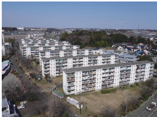
図4 神奈川県営いちょう団地 (横浜市泉区上飯田町)