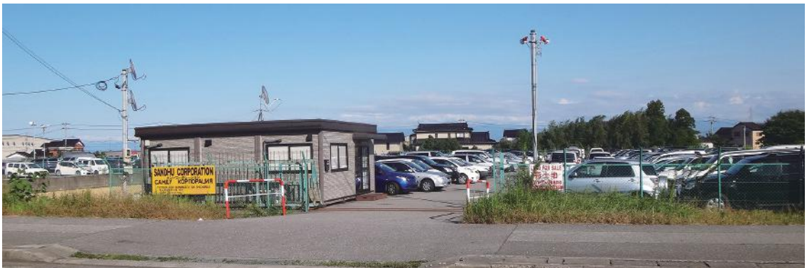
図2 パキスタン人経営の中古車販売店(富山県射水市)

伏木富山港周辺の業者の仕出港は、ロシア向けは伏木富山港から、アフリカ・中東向けは名古屋港か横浜港からと使い分けている(福田編, 2013: 108-109)。パキスタン人の中古車輸出業は、グローバルかつトランスナショナルなムスリム・ビジネス・ネットワークにより、日本製中古車は、