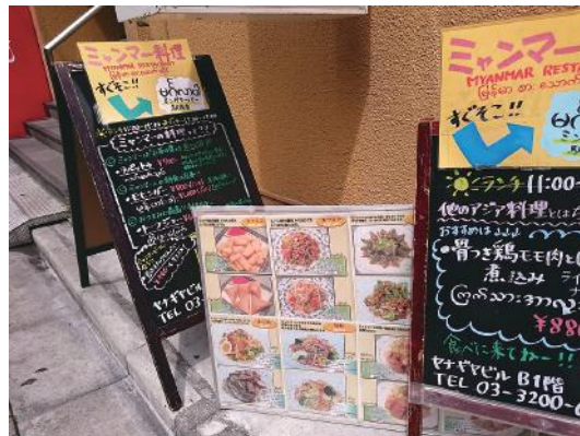
図5 東京新宿区のJR高田馬場駅近くのミャンマー料理店

日本政府は、1989年、入管法を改正（1990年施行）し、外国人に対する取り締まりを強化する