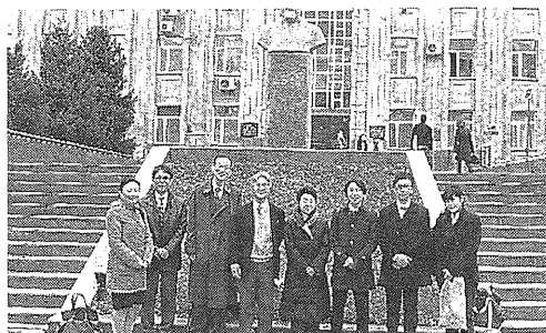
カザフ国立教育大学の正門前にて集合写真