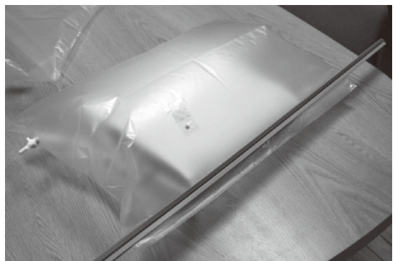
図4 ケミカル除去フィルターによる改質の試み

次にこれらのクリーニング法を検討することになった。貴重書は水洗ができないため、乾式でなおかつ物理的ストレスを避ける必要があり、ケミカル除去フィルターを用いた静置式リンスを実施した。放散成分とその量が既知であるため、それ