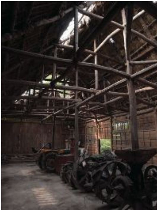
写真9 文化財登録された茅葺トラクター倉庫