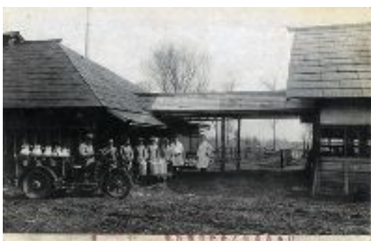
写真1 大正期の牧場景観