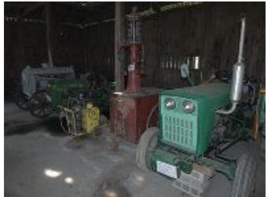
写真8 牧場内に現存する農業機械類