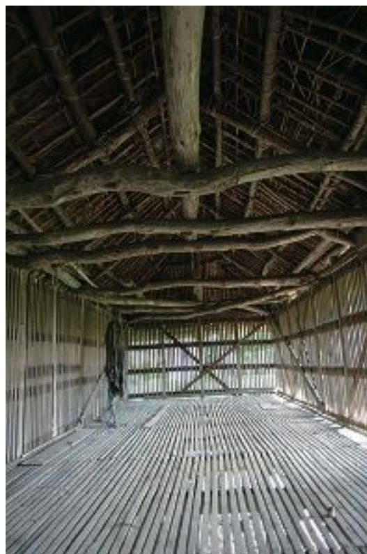
写真4 文化財登録されている玉蜀黍倉庫