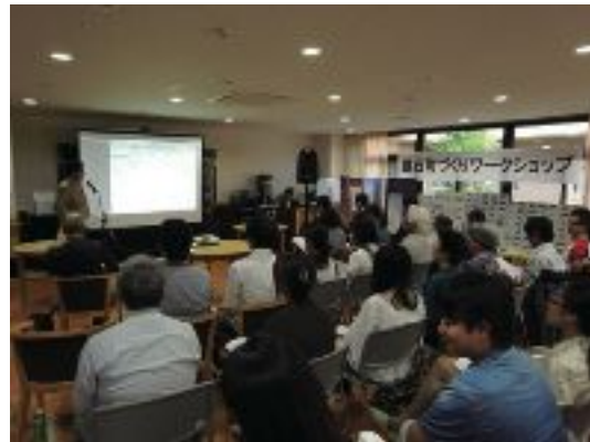
写真11 まちづくりワークショップの開催