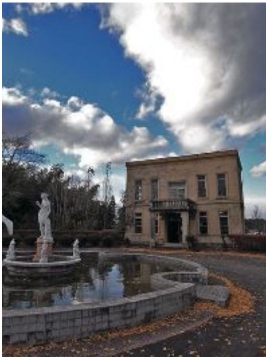
写真10 文化財登録された旧事務所棟