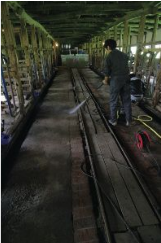
写真6 旧五号牛舎内トロッコ軌道の清掃