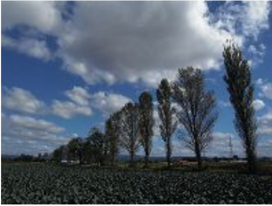
写真5 牧场景観を特徴付けるポプラ並木