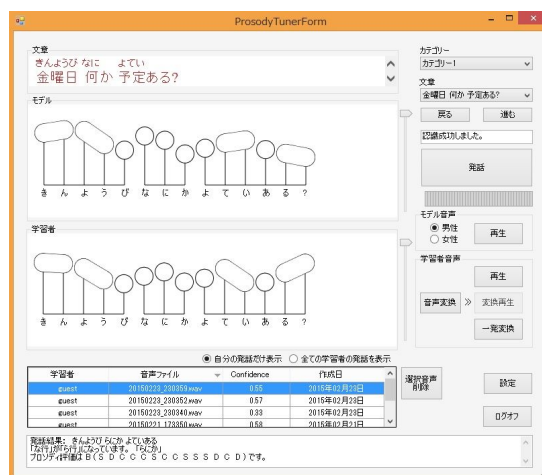
図3 「Prosody Tuner 2015」の画面

その他、画面拡大に伴うゲージ移動の不具合および、画面切り替えに伴う評価表示の消滅の不具合を修正し、男女の声の高さに合わせて表示を最適化するようにした。また、音声の合成と出力を1クリックで行えるようにした。これらの機能修正のアイデアは、すべて学習者の試用時のコメントから得られたもので、最終的には、かなり使い勝手がよくなったと言える。