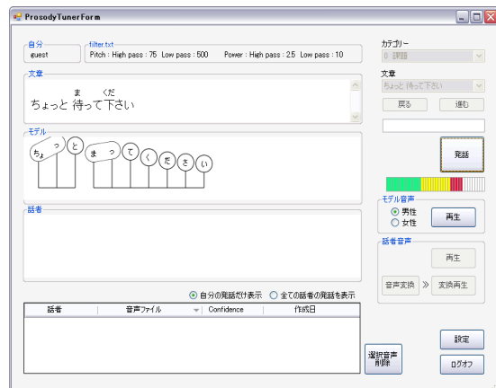
図 1 「Prosody Tuner2011」の画面

そこで、本研究代表者は、基盤研究(B)「音声認識技術を取り入れた日本語発音自学システムの開発」(課題 ID 21320094)で共同研究を行い、入力音声のリズムを補正した「プロソディグラフ(高さ・長さを音符のように示した視覚教材)」を自動的に出力する「Prosody Tuner」を開発した。2011 年度の開発画面(一部)は、図 1 のようである。