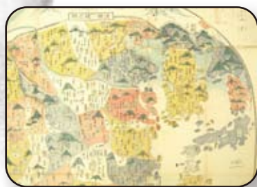
だいしんりょうぜんず ▲大清輿地全圖