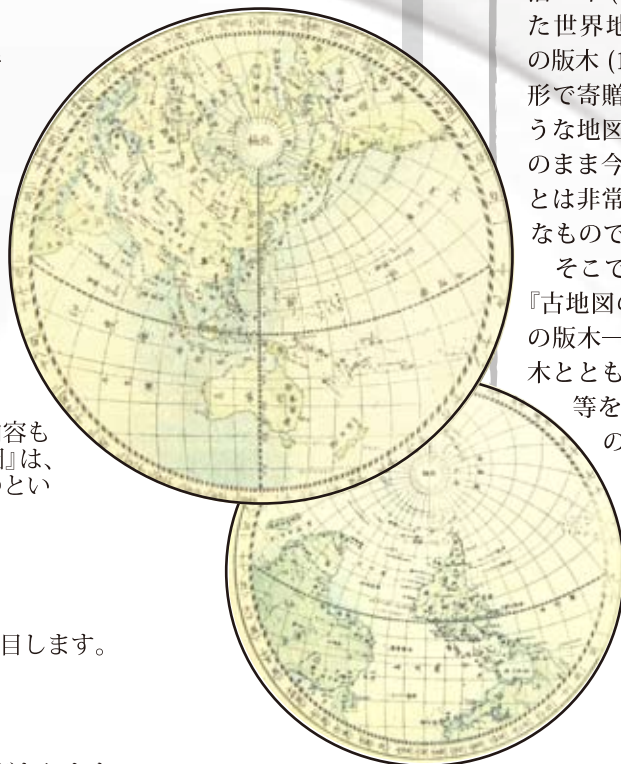
じゅうていばんこくぜんず ▲重訂萬國全圖

世界図以外にもいろいろな地図があります。古地図にまつわる色々なトピックスを取り上げます。