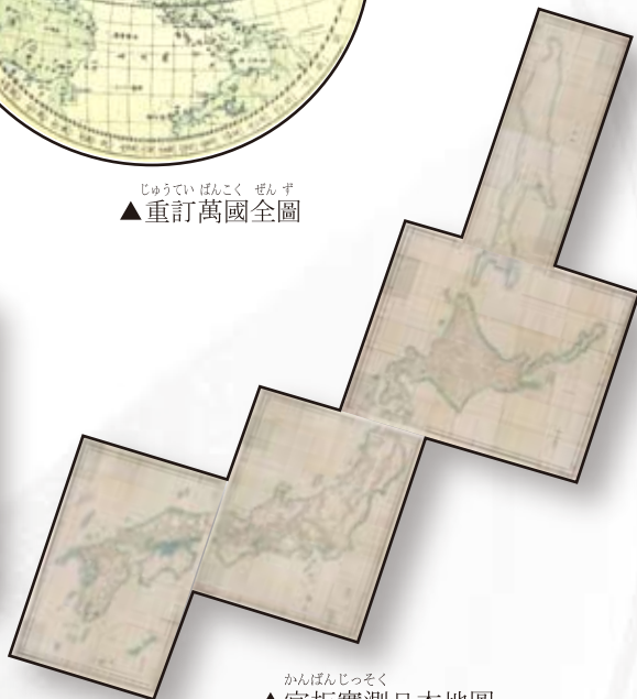
かんばんじっそく ▲官板實測日本地圖