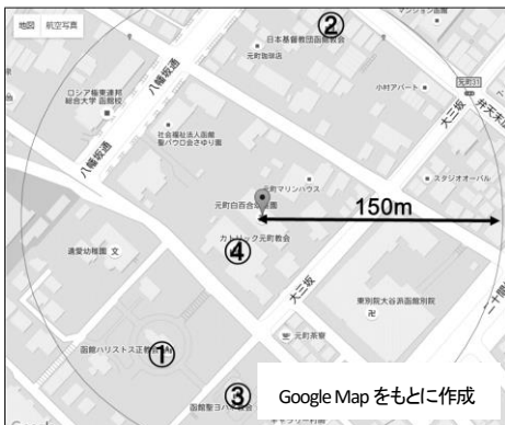
図1. 対象教会の位置関係(数字は表1の番号に対応).