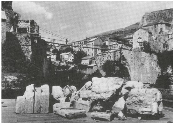
図 2 紛争後のモスタル古橋 (1997 年撮影) 5

人勢力を主張するものであったこと、軍事的理由やかつてのボスニア・ヘルツェゴヴィナの民族が共存していたことを示すものであったことなどが挙げられる。