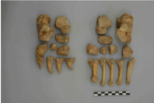
らい病を患った可能性のある 305 号人骨（足）

性が高いこと、東タペの人々は中央アジア最古の農耕文化であるジェイトウン文化に深く影響を与えたことなどが判明していません（発表、 、 図書）。出土人骨の中には、らい病あるいは重度のリウマチを患ったと推定される人骨が含まれていることなども、注目を集めています。