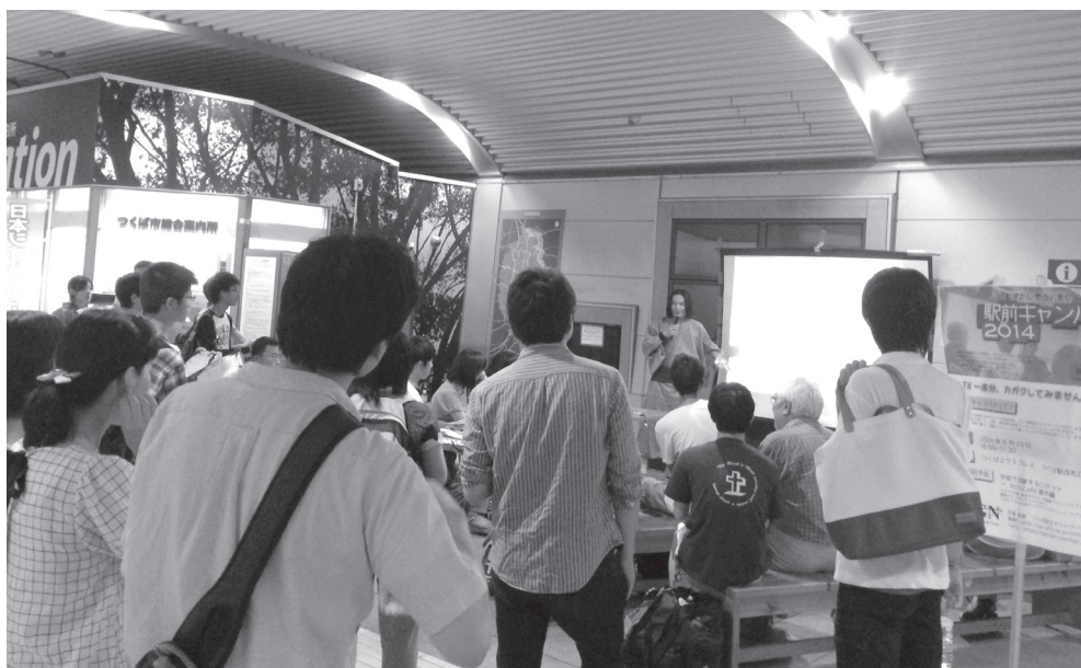
写真:駅前キャンパス2014第4回の様子

宇宙〇×クイズでは、宇宙開発だけではなく天文学などさまざまな宇宙に関わる内容のクイズを出題し、参加者に手で〇や×を作って回