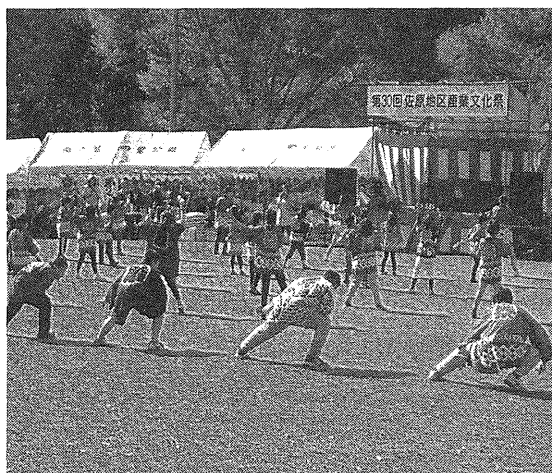
写真 3-2. よさこいソーラン節

このような、普段とは違う親や先生の姿を子どもたちが見ることができるのはとても貴重だろう。子どもたちは大人たちの新たな側面を知ること、大人たちを捉え直し、自己の理想の大人像を構築していくはずだ。お父さんのようにたくましくなりたい、お母さんのように子