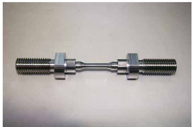
丸型試験片接続棒