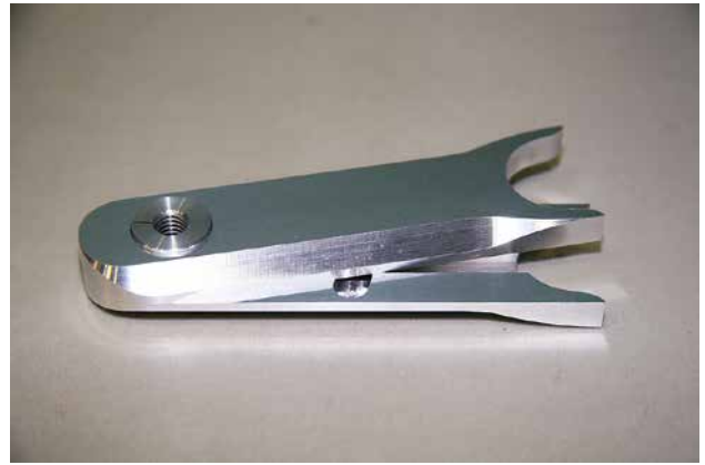
アルミグリップ部品