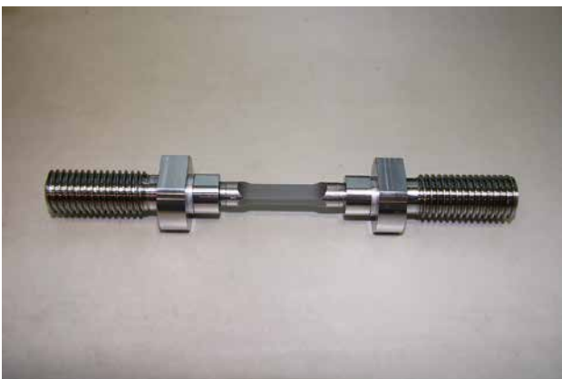
平型試験片接続棒