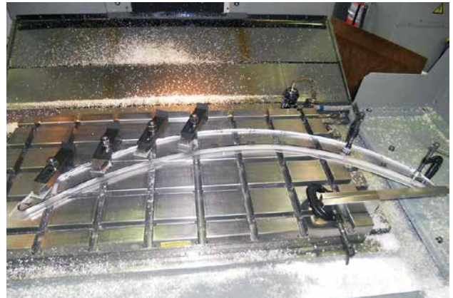
非対称弓形アクリル板加工