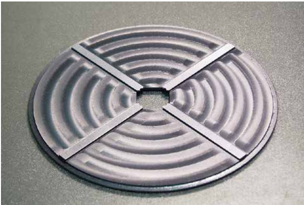
モリブデン基板ホルダー