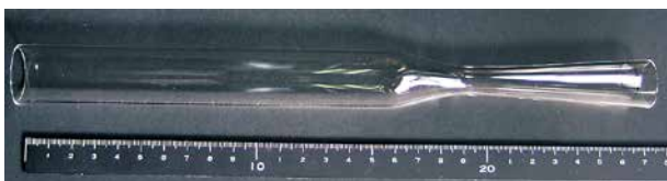
スラストノズル (石英製)