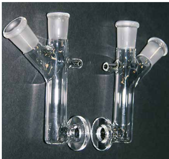
二分割式電解セル