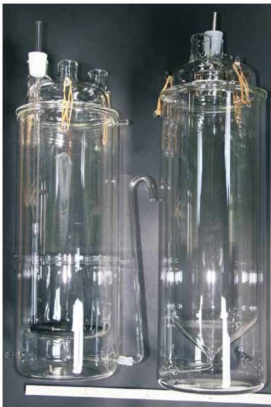
バイオリアクター