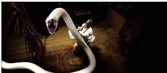
図 31 9

映画『白夫人の妖恋』の白娘は、あまりにあっけなく許仙に殺されてしまう。彼女は千年以上も生きてきた白蛇であり、妖術も使えるのである。それが許仙に踏みつけられて簡単に死んでしまうとは、白娘のキャラクター造形として不可解さは残る。白娘が深く愛している相手だからこそ、その彼に力いっぱい踏みつけられると、死ぬしかないというわけであろうか。そもそも『白夫人の妖恋』における白蛇の大きさは、中国民話や林房雄の『白夫人の妖術』の十五メートル以上もある大蛇にくらべると、迫力に欠ける。ひとが簡単に踏みつけることができる小さなサイズなのである。中国の白蛇伝映画 8 においては、白蛇は巨大であり、民話を忠実に映像化しようとする。本場中国の映画が示す白蛇の巨大さと比較すれば(図31)、『白夫人の妖恋』の白蛇の小ささと弱さは際立つ。