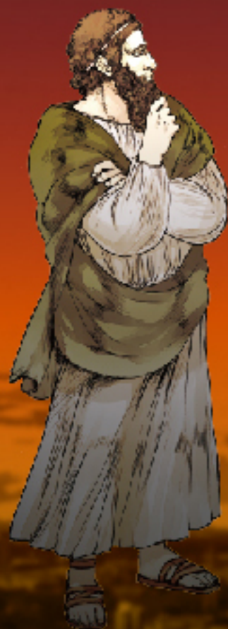
アルキメデス (287B.C. - 212B.C.)

根子の原理で有名であるが、数学者としての眼を持ち、 求積法（放物線の切片の面積等）でも名高い。