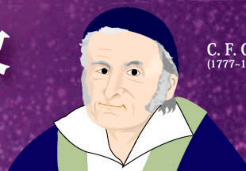
C. F. Gauss (1777-1855) ドイツ

数理物質科学研究科 数学専攻 http://www.math.tsukuba.ac.jp/