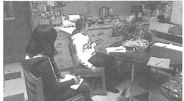
アメリカでESLの実際を見学する生徒C

問し調査活動を行った。なお、3名の生徒の活動については、本校主催の第17回総合学科研究大会（2014年2月20・21日）において生徒たち自身が報告を行った。