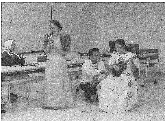
お互いの国の文化も紹介しあう (写真はフィリピン大附属高チーム)

各校からのプレゼンテーションの後には、「持続発展可能な社会づくりのために高校生ができること」をテーマ