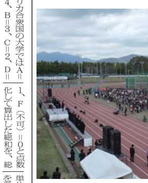
地震の影響で陸上競技場で行われた「青空入学式」