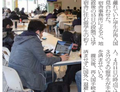
メールで安否確認を行う留学生

被災地の映像編集の関係者、消防署職員は一度に被災地へ出かける。被災地の映像編集の関係者、消防署職員は一度に被災地へ出かける。