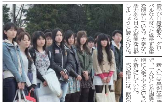
学長式辞を真剣な面持ちで聞く新入生

「青空」の下で開催 学ぶ決意新たに 平成23年度入学式と父兄が陸上競技場に集り、大学院合同入学式が、4月20日に行われた。 今年度の入学式は、3月11日に発生した東北地方太平洋沖地震より、例年開催所としていた大会館の発煙や柔軟な思考、多様な価値観を尊重して、自主性を重んじてほしい。みなさん、陸上競技場場所を移して開催された。 前日の雨の影響も、わずかな緊張がたつた。問題にも触れ、「この困難にあたり、筑波大生は人