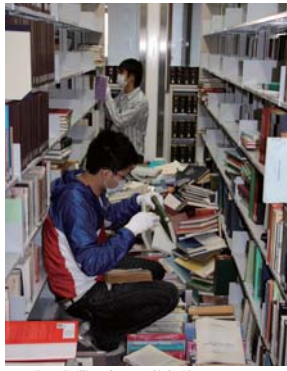
復旧作業に当たる学生ボランティア

つくば市や社会福祉協議会と連携しながら、被災者の生活支援に力を入れている。被災者の生活支援に力を入れている。被災者の生活支援に力を入れている。