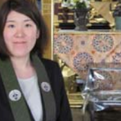
「誰に無常(しよぎょ)も分かれません。年齢の順に死を迎えるのも限られます。必ず明日があるという保証もありません。だからこそ、仏教で

私は佐野の浄真宗のお寺の後継者として育ちました。後継者には、いろいろな責任が押しつけられてきます。反発し、しばしば人材界の営業としてバリバリ働いたりしましたが、2