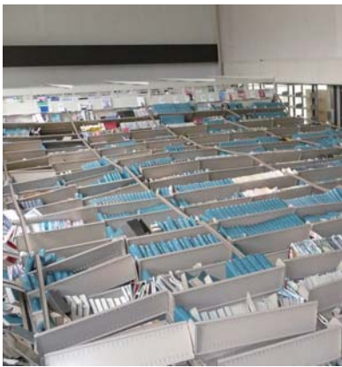
書架が転倒した体芸図書館