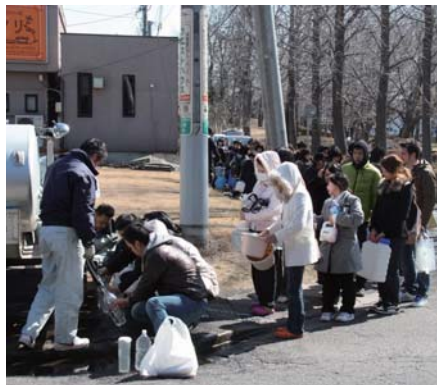
天久保公園の給水所には多くの人が並んだ