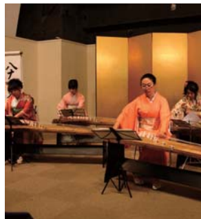
華やかな着物をまとう演奏者たち