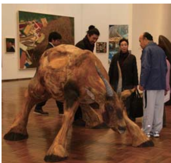
中央に置かれた水牛に似た木彫