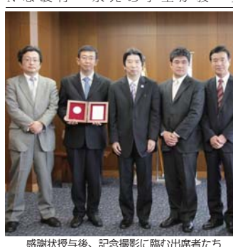
感謝状授与後、記念撮影に臨む出席者たち

二期制への移行は、宿舎等の設備更新が必要である。宿舎の設備更新は、特第一期工事を優先して進めたい。 また、従来の二期制は、夏季休業を挟んでまい、授業日程に合わせた設備更新が必要である。宿舎の設備更新は、特第一期工事を優先して進めたい。