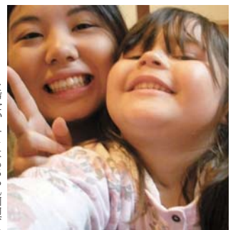
ホームステイ先の女の子とパシャリ

が、始めの数は思わす物布にしてしまっていました。しかし、みなフレンドリーで、言葉が上手な振りや表情でコミュニケーションをとりながら、英語を学ぶにはとてもいい環境だと感じました。