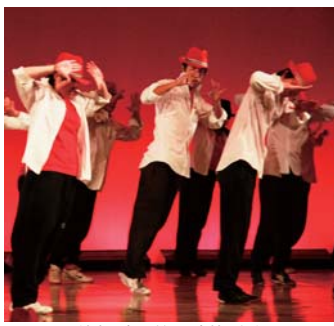
迫力のあるダンスを披露した

筑波大学舞踊研究室が主催する卒業ダンス公演、舞踊研... 2月17日、本学... 舞踊研究室卒業生による... 「あなが生まれ先の下... 高橋・美智の愛護有志による... 舞踊で観客魅了した。