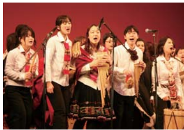
力強い歌声で会場は熱気に満ちた

筑波大学フォルクローレ愛好会がフォルクローレコンサートを開催した。... 12年生有志によるアンデス地方の伝統的舞踊も披露された。