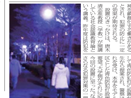
青色で犯罪抑止をねらう

不審者による犯罪防止をねらう、学生街周辺の警察署の協力の下、大学周辺の危険な場所が学生が調査した。科学的根拠は示されていないが、青色は人の瞳孔を鎮静化する働きがあるとされ、犯罪防止に一定の効果も期待される。 設置のきっかけは、唐木清准教授(法学)が開講している社会実験教育論という講義。昨年度は防犯をテーマにした青防犯灯設置を要請した大学側がそれに応じて、今回の設置に至った。この講義は防犯をテーマにした青防犯灯設置を要請した大学側がそれに応じて、今回の設置に至った。