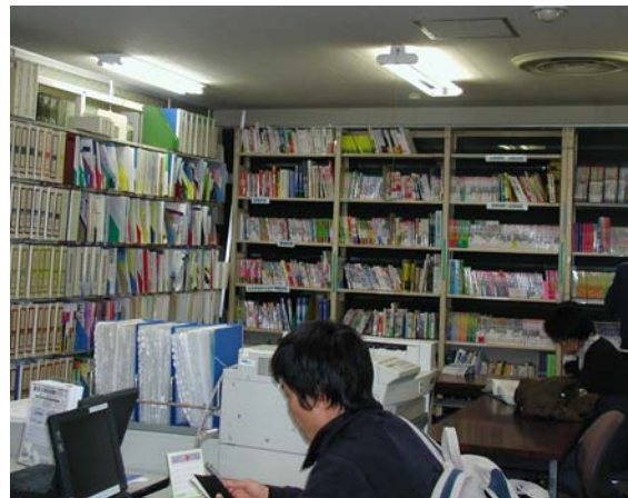
就職課に併設されている就職資料室。豊富な資料が揃う

公務員志望の学生には、6月から各官庁の人事担当者来学して行う省庁ガイダンスと、12月に行われる国家一種や二種から地方上級、外務・国税専門官など多くの職種に合わせた、職種の公務員模擬試験(有