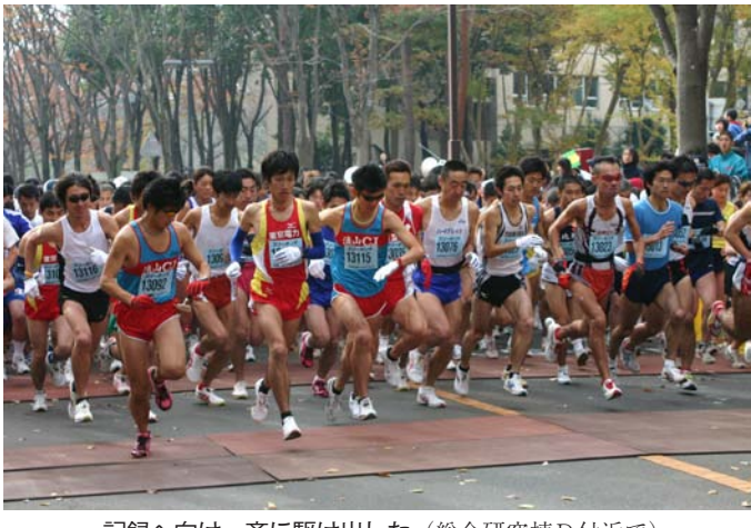
記録へ向け一斉に駆け出した(総合研究棟D付近で)

第26回つくばマラソン(主催:本学、つくば市、読売新聞社など)が11月26日、本学陸上競技場などをメイン会場にして開催された。今回は、史上最多参加者数を記録した昨年を249人上回る1万1268人が参加した。参加者はフルマラソンと