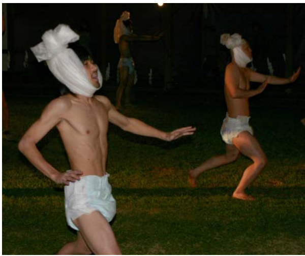
「無題」のか、相模原の学生を上演する学生

芸術専門学群の構成専攻「快樂記念館」と題した総合造形領域が開校して1年。パフォーマンスを披露する通年授業「展示造形・パフォーマンス」の受講生12人が11月17日、開学記念館で15の作品を午後6時半から約1時間半かけて上演した。当日は寒さが厳しく、厚手のコートを羽織る人が目立つ中、体を張ったパフォーマンスが会場を沸かせた。「水模様」では、上半身裸の男が突然屋根の上に登場し、持っていた水を撒き散らすと、照明装置と屋根を伝う水滴で光と水のアートが現れた。その他、スクール水着姿の緑色のシチュエーションを演じる「ヘルシ」を指す人の不健康な精神など、総合造形の作り出す独特な世界観に、会場からは歓声や笑い声が上がった。