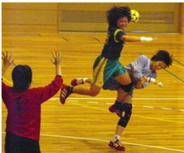
ハンドボールの学生日本選手権大会が11月16-20日、中村スポーツセンター(名古屋)をメイン会場に開催され、女子が