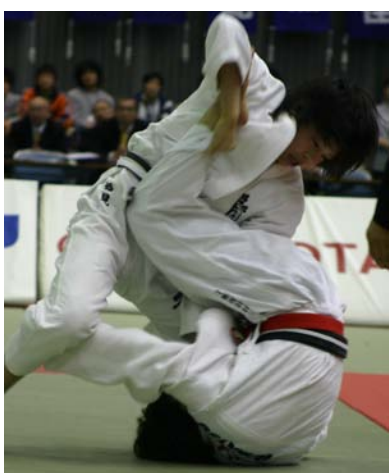
力の差はないだけに、悔しい敗戦だった

国内各階級の頂点を争う講道館杯が11月18-19日にかけて、千葉ポートアリーナ(千葉市)で開催された。本学からは18人が出場し、