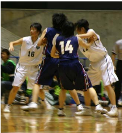
意地を見せた3位決定戦(代々木競技場で)

大学バスケットボールの日本一を決める全日本学生バスケットボール選手権が11月19-26日、代々木競技場第一体育館(東京・渋谷区)で開催された。優勝は99-79で破った。