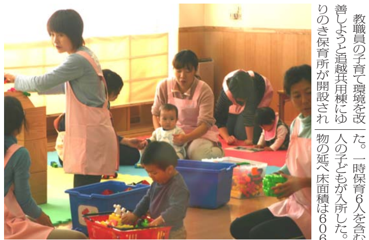
保育所の中で遊ぶ子どもたち(ゆりのき保育所で)

教職員の子育て環境を改善しようと追越兵用棟にゆりのき保育所が開設された。一時保育6人を含む15人の子どもが入所した。建物の延べ床面積は606平方メートル、屋外遊技場は260平方メートル。12月1日から運営を開始した。保育日は月から土曜日まで、午前7時から午後9時の14時間、保育を行う。1日には開所式が行われた。開所式には、学内関係者のほか、つくば市の職員ら2人が参加した。式では、岩崎洋一学長によるあいさつと、桜の記念植樹や施設見学が行われた。