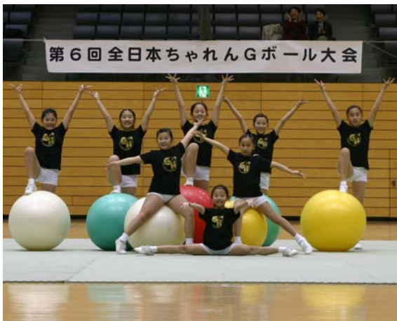
オープン部門で優勝した、グリーンHOPトップチーム