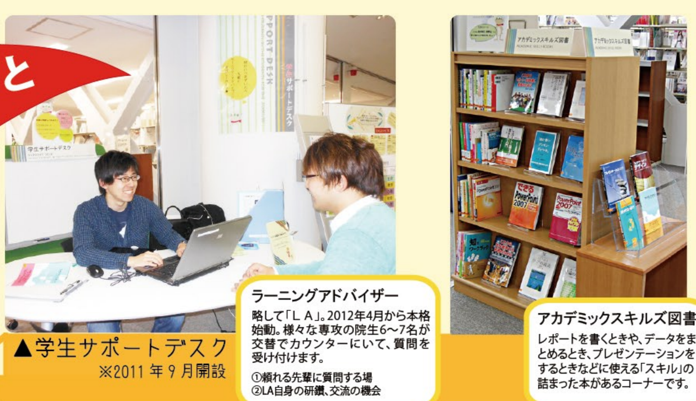
▲学生サポートデスク ※2011年9月開設

ラーニングアドバイザー 略して「LA」。2012年4月から本格 活動。様々な専攻の院生6~7名が 交差点カウンターにて、質問を 受け付けます。 ◎頼れる先輩に質問する場 ◎LA自身の研鑽、交流の機会