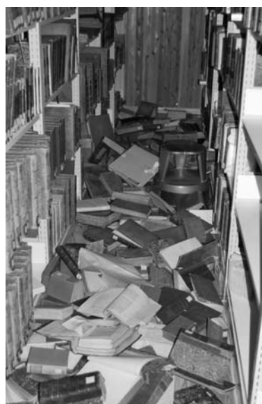
写真4 貴重書庫（中央図書館新館1階）