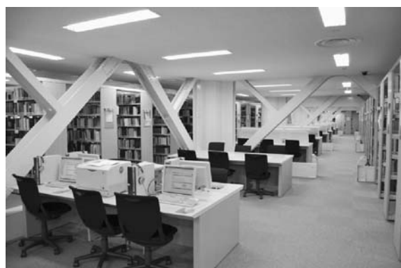
写真1 耐震ブレース（中央図書館本館4階閲覧席）

地震直前の2011年1月に中央図書館が3年間にわたる耐震改修工事を完了したばかりで、続いて専門図書館の工事を予定していた（写真1）。