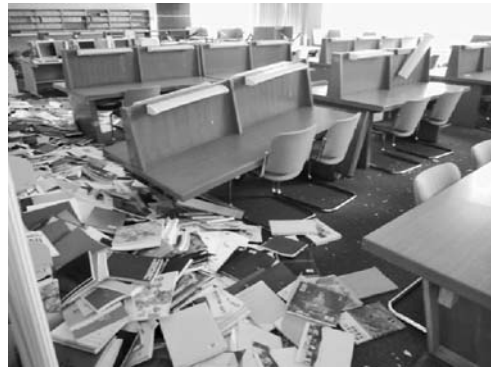
写真6 閲覧機の破損 (体芸図書館3階)

中央図書館では落下図書約110万冊および電動集密書架内で被災した多くの製本雑誌の復元が必要であり、復旧作業は長期にわたることが予想された。そのため、あらかじめ復旧場所の優先順位や作業の割り振り等、綿密な計画を立ててから実施した。まずは入退館ゲートと各種カウンターが存在する本館2階と100席の閲覧机および文庫・新書書架を配置する新館2階から作業を開始した。高層階ほど余震による影響が大きいこと、電子ジャーナル等の代替手段が少ない図書を配架する本館の復旧が急務であることを考慮した結果、本館3階(人文科学図書)→本館4階(社会科学図書)→本館5階(自然科学図書)→新館3~5階(製本雑誌等)および本館1階(旧東京教育大蔵書)、新館1階(古典資料等)の順番で行うことになった。