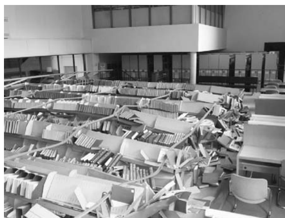
写真5 製本雑誌架の倒壊（体芸図書館1階）