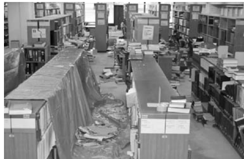
写真8 温水管破裂のため漏水 (医学図書館1階)