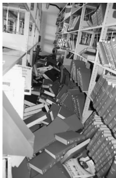
写真3 電動集密書架（中央図書館新館5階）

震災当日から翌週にかけては、計画停電や不安定な通信状況、図書館職員全体制での館内復旧作業など大変厳しい環境であったが、Twitter を皮切りにあらゆる手段での情報発信とウェブサービス上で