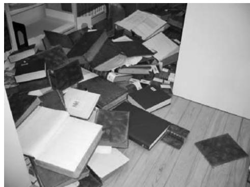
写真9 落下による図書破損 (図情図書館貴重書庫)