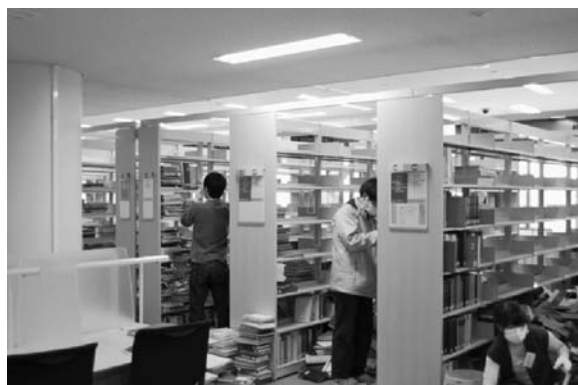
写真11 ボランティアによる復旧作業の様子

図書館復旧ボランティアの一日の流れは、おおよそ以下のようなものである。まず事前申し込みした時間に図書館に集合し、担当職員に氏名等を伝える。初めて参加する場合は避難経路や書架の並び、シュルフリーディングの要領、作業のコツなどの説明を受け、マスク・軍手・復旧ボランティアバッチを装着する。そして約2時間、ひたすら散乱する図書を整理する。書架間は落下図書で埋まっており、まず自分の足元を確保することから作業は始まる。折り重なって積み上がる図書を1冊ずつ整理し、請求記号順に書架に戻していく。落下の衝撃や最下層に埋もれていたため加重による圧迫で破損した図書は、「要修理」と書かれた一時保管用段ボールに集める。地道で根気のいる作業だったが、参加者の意欲は高かった。作業時間途中での退出や休憩は、同フロアで作業中の担当職員に報告さえすれば自由であったが、ほとんどの参加者は終了時間まで、時には時間を超過して作業にあたっていた(写真11)。