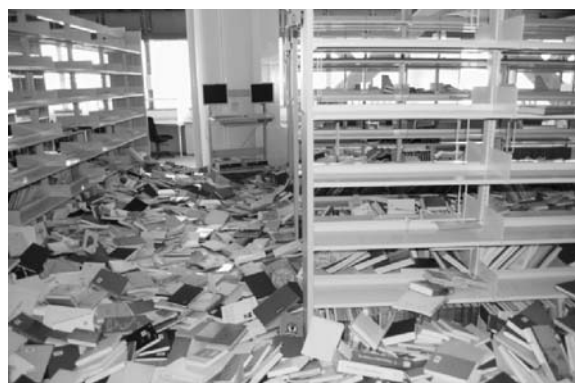
写真2 通路使用不可能(中央図書館本館4階)

図書館全体としての最も大きな被害は蔵書の落下である。全館合わせて約150万冊の図書が書架から落下した。これは全蔵書の6割に相当する。電動集密書架に配架されていた製本雑誌の落下も含め、かつてない大打撃であった。ただし図書館サーバがほぼ無傷であったことは、その後の復旧作業にも大いに役立つことになった。