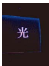
図3. 高分子薄膜中に作成された金クラスターの写真。フォトマスクを用いて高分子中に金クラスターで“光”の文字を書いている。

(2) 金クラスターは一酸化炭素の無害化やアルコールの酸化、カップリング反応など多