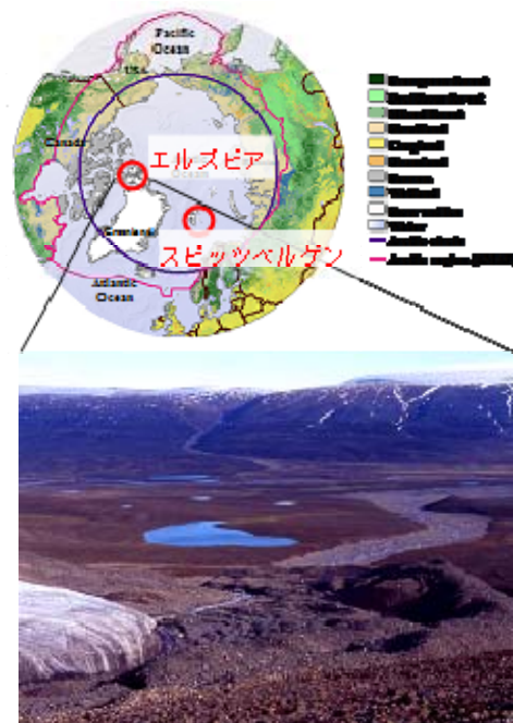
図1 研究対象地としたカナダ・エルズビア島ならびにノルウェー・スピッツベルゲン島（写真はエルズビア島氷河後退域調査地点）

本研究ではカナダ北極エルズビア島（北緯80度）を調査地に選定した。理由として、国際極域観測基地がノルウェー政府により設置されこれまでに先行研究が行われているノルウェー北極海スピッツベルゲン島（ニールスン）同様に、氷河の後退が毎年進行しており急激な温暖化による環境変化を受けている地域の一つであること、また、エルズビア島では、国立極地研究所が2001年から陸域生態調査を始めており、本研究を遂行するにあたり必要となる現地の情報を得られること、が挙げられる。