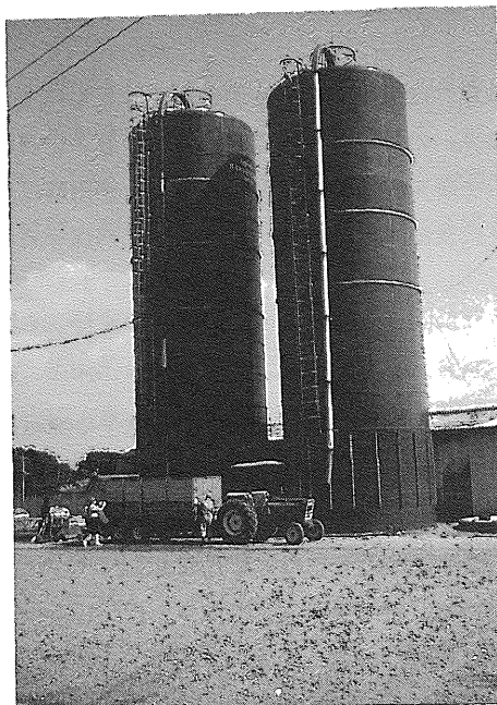
サイレージサイロ