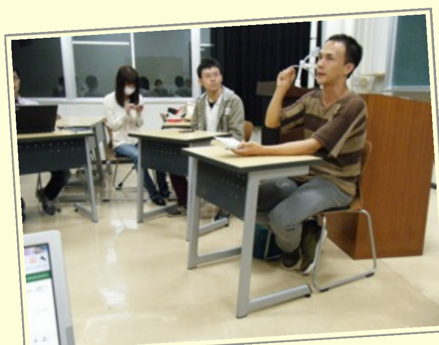
ブックトークは人気企画