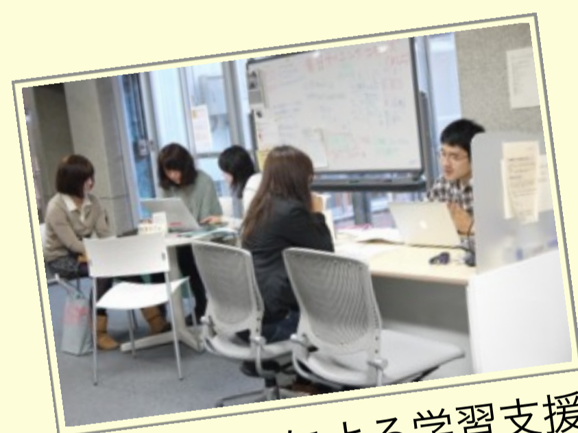
チューターによる学習支援