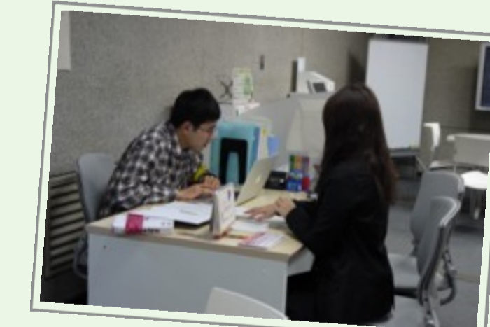
レポート締切前は大忙し