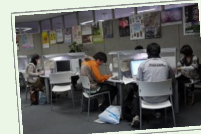
プログラミングもできます