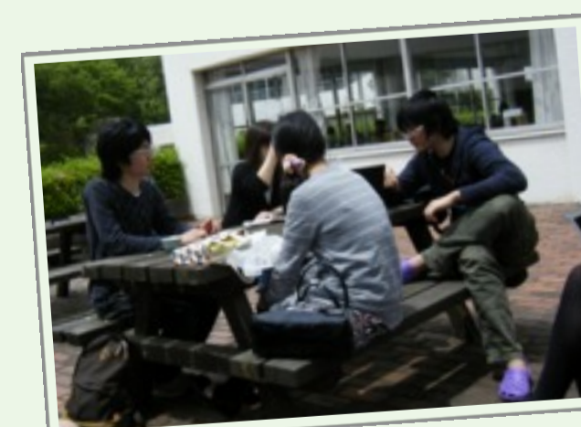
青空ミーティング