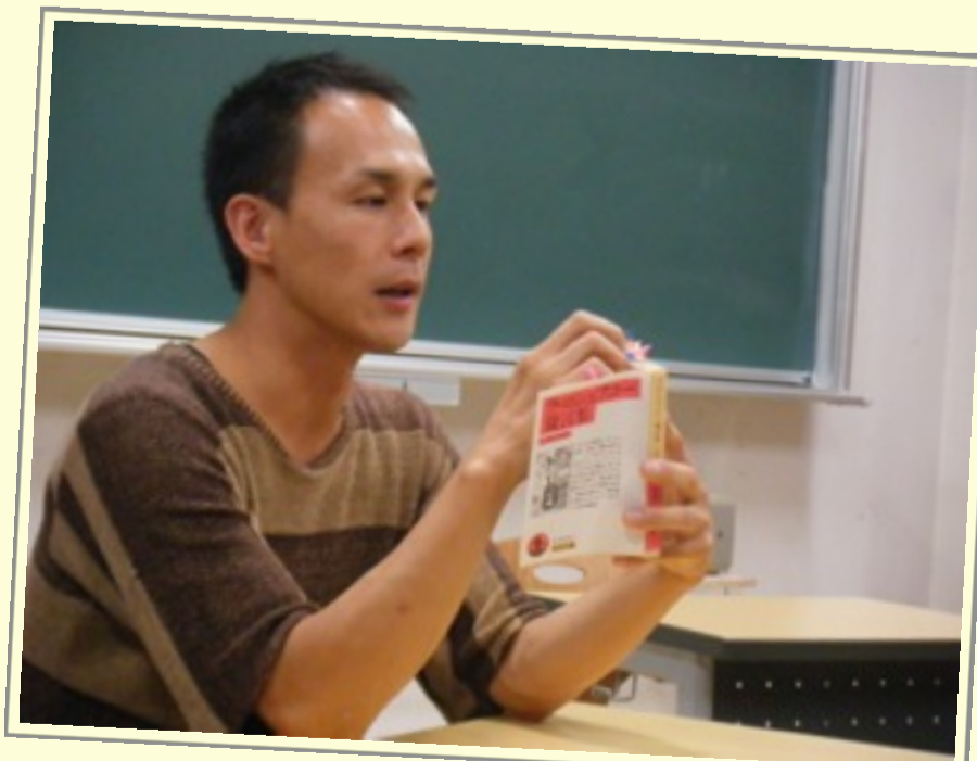
先生もブックトークに参加