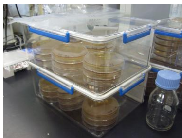
図5. アネロパックを用いた嫌気培養

「夏休み自由研究お助け隊 2005—『醗酵とは？かびとは？』」、 「夏休み自由研究お助け隊 2006—『ヨーグルトの乳酸菌を観察しよう』」では、半日の実験とし、説明、植菌、顕微鏡観察を行って、植菌済みのシャーレを持ち帰る形式を取った。この形式ではその後のシャーレの状態がこちらで把握できず、実験がやりっ放しで終わってしまう可能性があるため、「夏休み自由研究お助け隊 2007—『身近な微生物を観察してみよう』」からは2日間連続、半日ずつという形式を取った。1日分の培養を学内で行うことができるため、アネロパックを用いた嫌気培養(図5参照)など、培養条件のバリエーションが広がること、自分で植菌した微生物を顕微鏡観察できることなど利点が多く、その後は今年度までこの日程を採用している。