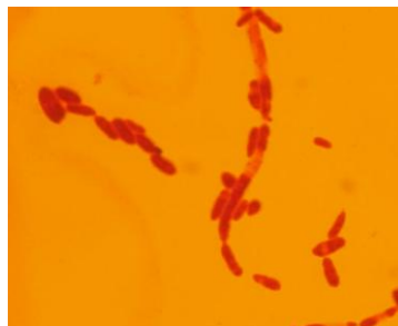
図 3. 乳酸菌の顕微鏡写真（ヨーグルト由来）

はなくアネロパックを使用した簡便な方法を採用することができた。ただ、②の問題点、「顕微鏡観察した場合の菌の形態にバリエーションが少ない。」を改善することはできなかった。