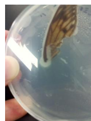
図 4. ユニークな分離源の例 セミの羽から分離したバクテリア

この年に「微生物」＝「植物プランクトン（ミカヅキモなど）、動物プランクトン（ミジンコなど）」と解釈していた受講生がいたため、翌年からは「夏休み自由研究お助け隊 2009—『身近な微生物（細菌・酵母・カビ）について調べてみよう』」、「夏休み自由研究お助け隊 2010—『微生物：細菌・酵母・カビについて調べてみよう』」、など具体的な表記をするように心がけた。実験内容、使用する培地などについては 2008 以降大きな変化は加えていない。