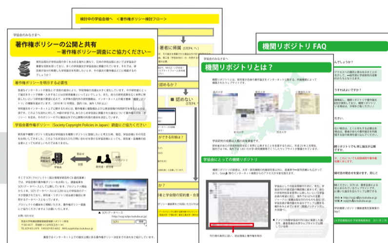
※国大図協学術情報委員会「機関リポジトリとは？」のチラシ(緑)も同封