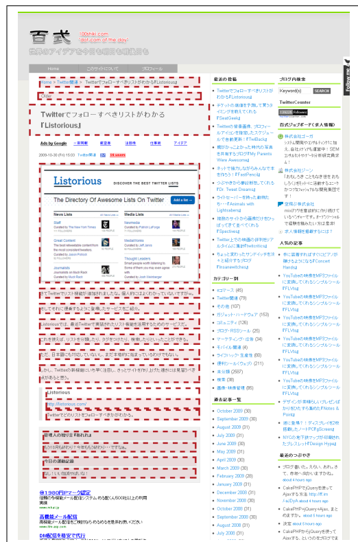
図 3 抽出ルール適用例（破線部分）