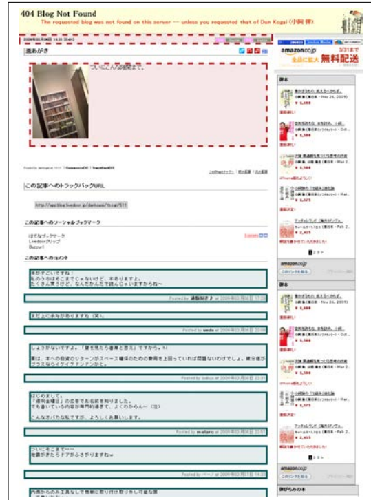
図 4 図 3 と同じブログページを提案手法によって分離抽出したところ, コメント部分の取りこぼしが適切に抽出できた (破線矩形部分がポスト, 実線矩形部分がコメントを示す).

data/research/survey/telecom/2009/2009-02.pdf (cited 2010-01-12), 2009.