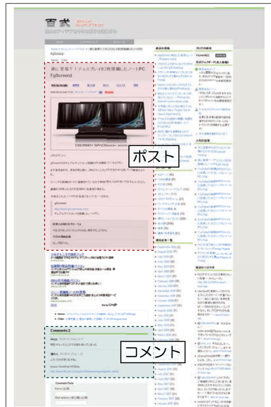
図 1 ブログページにはコンテンツではない不要部分が多く存在し、コンテンツはポストとコメントに分かれる。

ポストとコメントを分離抽出する先行研究として Cao ら [6] があり、我々はその先行研究が抱える問題点のい