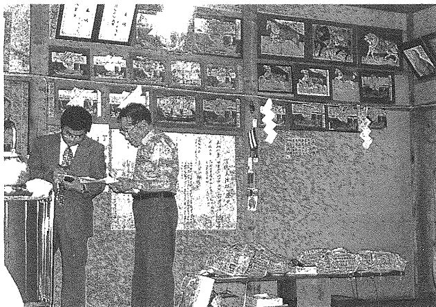
写真5 言代主神社の絵馬