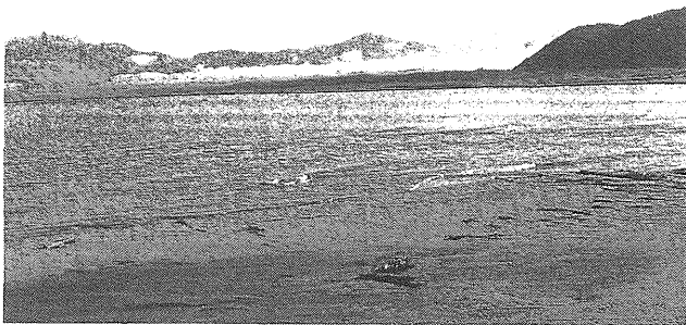
写真3 太櫓の海 石灰藻の海