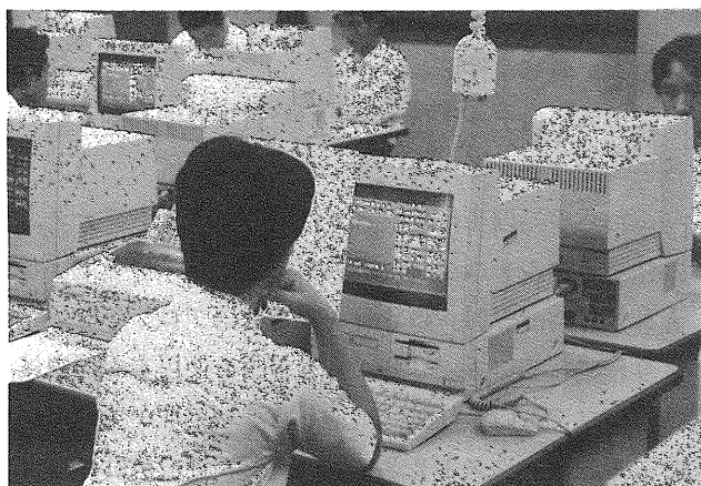
図3 「科目選択処理ソフト」を使用している場面

科目の選択は、「総合学科」の原則履修科目である「産業社会と人間」の中で行う。生徒は、受講を希望する科目の開設日時、単位数や、履修条件を調べ何年次に